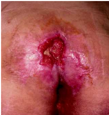
Abb. 2 Sacral lokalisierter Decubitus.