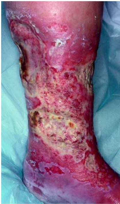
Abb. 1 Ulcus cruris venosum.