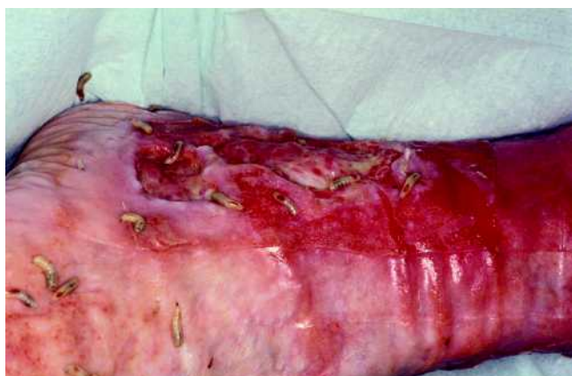
Abb. 7 Biochirurgen auf einem Ulcus cruris, nachdem der Schutzverband nach 3 Tagen entfernt wurde.