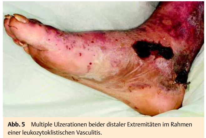
Abb. 5 Multiple Ulzerationen beider distaler Extremitäten im Rahmen einer leukozytoklastischen Vasculitis.