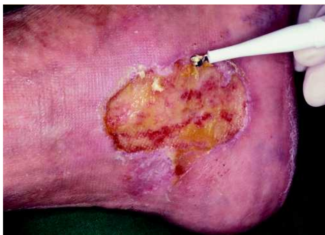
Abb. 6 Chirurgisches Debridement mittels Ringkürette.