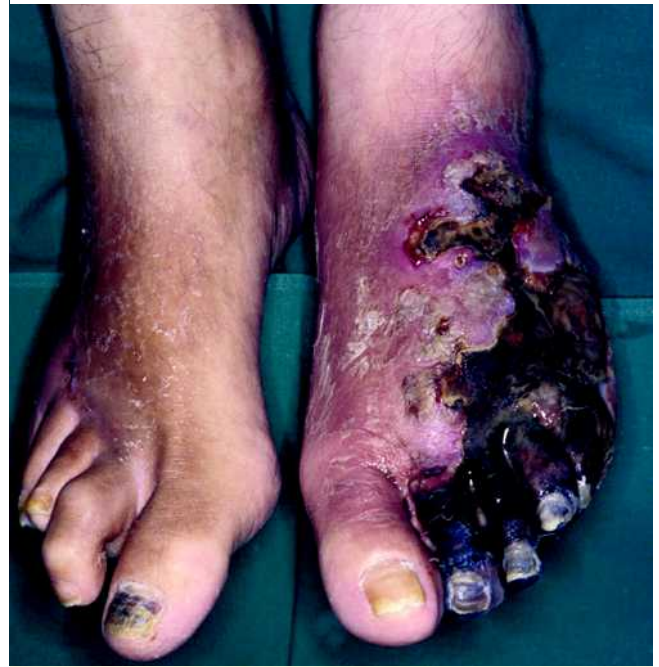
Abb. 4 Patient mit Ulzerationen bei fortgeschrittener pAVK.