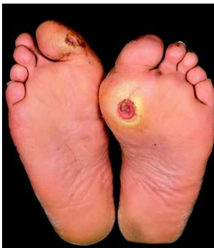
Abb. 3 Diabetisches Fußsyndrom mit neurotrophen Ulzerationen plantar und jeweils am Digitus I.