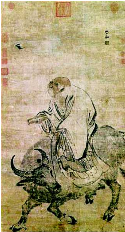
Abb. 2 Lao-tzu.