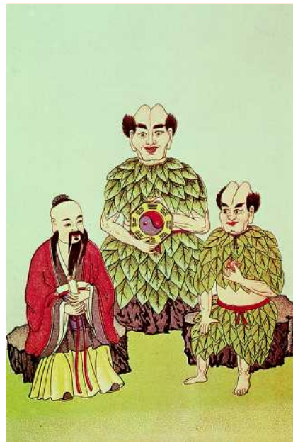
Abb. 1 Die legendären Kaiser Huang-ti , Fu-hi und Shen-nong (v. l. n. r.).

Fu-hi soll das Abkochen der Nahrung erfunden haben, und ihm wurde retrospektiv die Zusammenstellung des „Buchs der