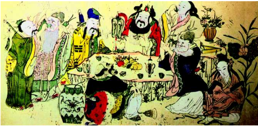
Abb. 3 Die „Acht Unsterblichen“.

ehrter taoistischer Meister gilt Wei Po-Yang (2. Jh. n. Chr.), der mit seinem außergewöhnlichen Buch Ts'an Tung Ch'i („Dreifacher Einklang“) ein esoterisches Handbuch liefert, das einen entscheidenden Beitrag zur Entwicklung des Taoismus leistete. Das Werk zeichnet sich durch eine derart rätselhafte Ausdrucksweise aus, dass es ungeklärt bleibt, ob manche Passagen wie die Anweisungen, nichtedle Metalle in Gold zu verwandeln oder eine „Goldpille“ zu mischen, die Unsterblichkeit verleiht, wörtlich zu nehmen sind.