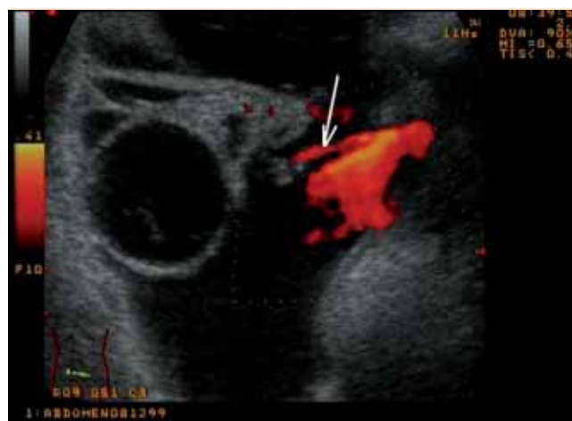
Abb. 4 Jet-Phänomen bei Urin-Leckage aus linkem Ureter ins kleine Becken; Darstellung im Power Doppler.

Fig. 3 Impressive jet-phenomenon caused by ureter leakage in b-mode; view in the small pelvis with ascites and ovarian cyst, marked by arrow.