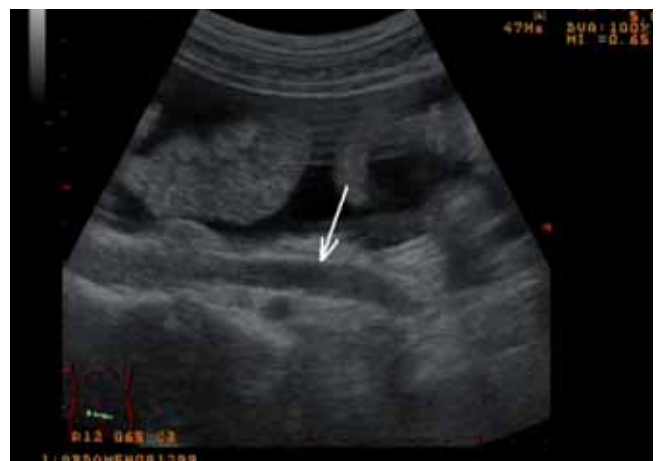
Abb. 2 Dünndarmschlingen im Aszites und Darstellung des erweiterten Ureters links im Longitudinalschnitt.