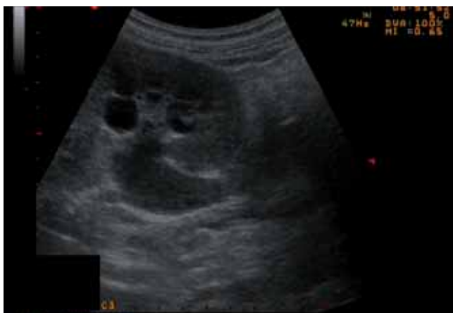
Abb. 1 Linke Niere mit Harnstauung und Darstellung des Ureterabganges. Fig. 1 Left kidney with urinary obstruction and the leaving ureter.

After being released, the patient noticed a continuous slow increase in abdominal girth which prevented her from returning to work. She was consequently readmitted to the surgical clinic 6 weeks later. Sonography ( Fig. 1, 2 ) and computed tomography showed a massive ascites in all 4 quadrants and hydronephrosis