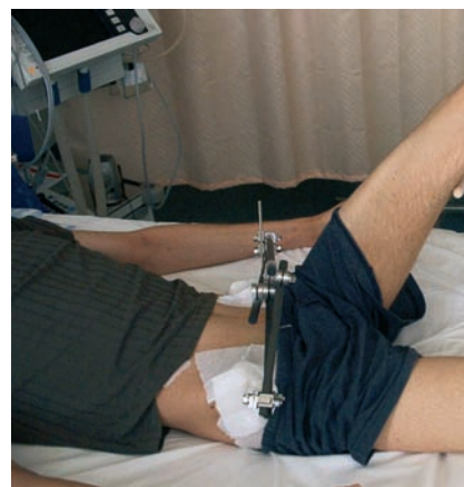
Abb. 3 Muskelkräftigung