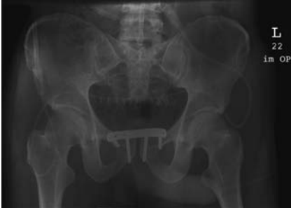
Abb. 4b Postoperative Beckenübersichtsaufnahme.

Sitz, Stand bis hin zum Gang, wesentlich. Die Mobilisation im Wasserbad bietet eine weitere Möglichkeit, die Phase des Belastens und Gehens vorzubereiten, sofern die Wundverhältnisse keine Kontraindikation darstellen. Der Auftrieb gestattet das Trainieren des Gehmusters bereits vor dem Erreichen der Belastungsstabilität ( Abb. 4a u. b ).