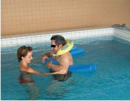
Abb. 4a Aquajogging vor Erreichen der Belastungsstabilität, B2.2-Verletzung bei Adipositas per magna, Symphysenverplattung.