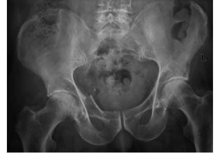
Abb. 6 A2-Fraktur eines 82-jährigen Patienten.

Mit Ausnahme von Rasanztraumen sind knöchernen Beckenverletzungen als Folge von Sportunfällen selten.