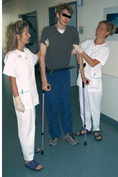
Abb. 5 Mobilisation unter Sicherung der B2-Fraktur mit dem supraazetabulären Fixateur.