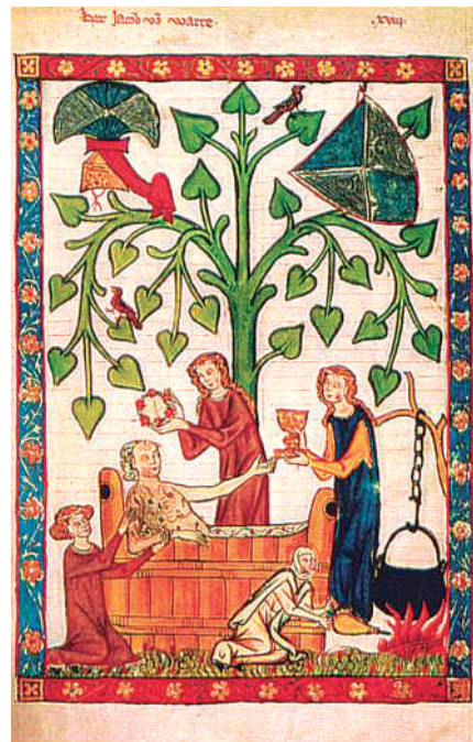
Abb. 3 Der Minnesänger Jakob von der Warte im Badezuber von Rosenblüten bedeckt im Garten, Miniatur (Cod. Pal. Germ. 848 [Große Heidelberger Liederhandschrift „Codex Manesse“], fol. 46 verso, Universitätsbibl. Heidelberg).

„Nach meiner Ansicht ist es aber von großer Wichtigkeit, dass unser Hofmann zierlich und geschmackvoll gekleidet sei und eine gewisse Gleichmäßigkeit in bescheidenem Putz zeige, je-