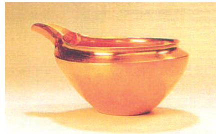
Abb. 1 Goldene Waschschüssel der Hetepheres I. aus ihrem Grab (Gise, um 2550).

„Wasche Dein Gesicht in Glück und Gesundheit, indem Du Freude genießt“ [23] (Abb. 1).