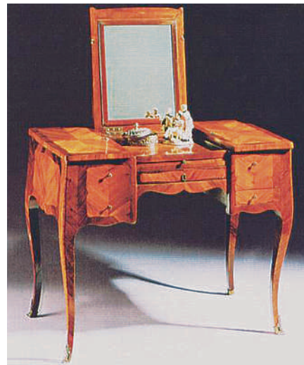
Abb. 4 Poudreuse. Rosenholz, Palisander, Messing, Frankreich, um 1750.

Es gibt bekanntlich rothe und weiße Schminke. Die gewöhnlichsten weißfärbenden Mittel sind: Der Sublimat, weißer Vitriol, Perlen, Benzoe, Wismuth, Bleiweiß, und hiervon vorzüglich das Kremserweiß, Koboldpräcipitat, Alabaster und weißer Puder. Roth färbt Karmin, Zinnober, Kugellack, die mit Zinnober gemachte Seife, Talch (ein venetianischer kalkartiger Stein) mit Safflor gefärbt, und die Blume der Amaranthe. Brandwein macht auch auf eine kurze Zeit die Haut roth, wegen seiner erwärmenden und zusammenziehenden Kräfte. Die Haare, Augenbrauen