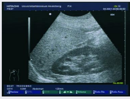
Abb. 1 Sonografie einer Fettleber

Das Leberparenchym ist gegenüber dem Nierenparenchym deutlich echoreicher, hier ausgeprägt im Sinne einer so genannten „weißen Leber“