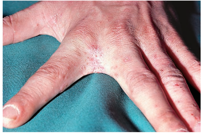
Abb. 5 Skabies mit entzündlichen Papeln und Schuppung aufgereiht entlang der Gänge bereichert durch Kratzeffekte an den Fingern und deren Zwischenräumen.

v. Chr.) und nimmt mit dem alleinigen Sonnengott Aton (Lichtberg) monotheistische Züge an (Abb. 3).