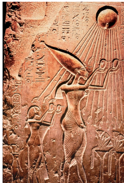
Abb. 3 Im Ägypten der Amarna-Zeit (1364–1348 v. Chr.) erbittet und empfängt der Priesterkönig Echnaton mit seiner Familie die Sonnenstrahlen für sein Volk.

Zudem weiß man seit einigen Jahrzehnten erst, dass eine UV-Be- lastung der Haut zu einer vorübergehenden Immunmodulation