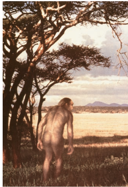
Abb. 2 „Der Mensch erscheint im Holozän“ betitelt Max Frisch seinen Roman von 1979 und meint die Ausbildung von dokumentierten Kulturleistungen, welche der Mensch infolge der Ausbreitung in die von der letzten Eiszeit fruchtbar aufgeschwemmten Flusstäler erbringen konnte.

Solches Leiden mit zunehmender Beeinträchtigung muss als Strafe der Götter aufgefasst werden, welche dem Menschen wegen eigener Verfehlungen und Unterlassungen oder solchen in der Familie oder durch Vorfahren widerfährt. Die Götter entziehen mit einem Bannspruch den Schutz und überlassen den Menschen der Krankheit, also in diesem Fall den Milben. Dem zu begegnen, also den „Bann zu lösen“, bedarf es einer fein entwickelten Folge kultischer und ritueller Handlungen, in welche zunehmend auch therapeutische Maßnahmen Aufnahme finden. Letztere entspringen den gut beobachteten Erfahrungen der „natürlichen Medizin“ und werden durch die Gottesdiener oder auf deren Anweisung hin durchgeführt. Priester sind auch die Heiler.