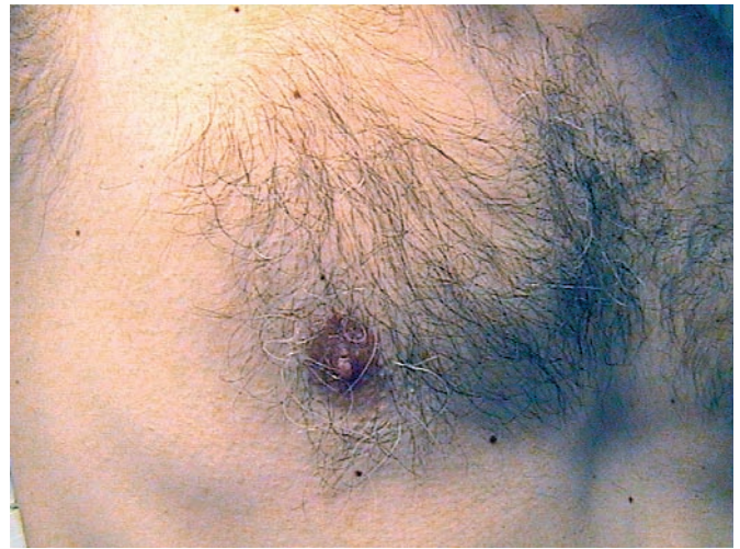
Abb. 3 Zustand nach Abheilung.