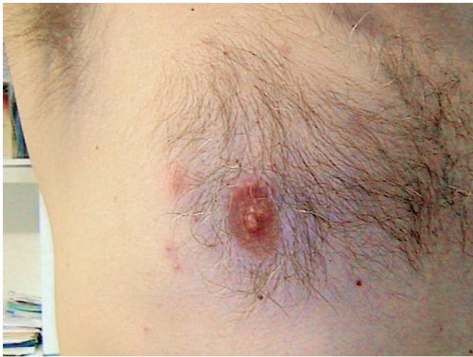
Abb. 1 Polymorphe Papeln an der vorderen Brustwand (Übersicht).