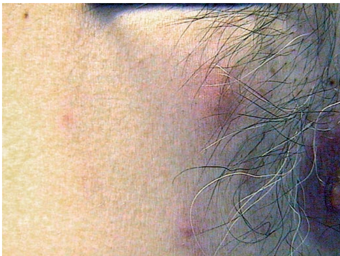
Abb. 2 Polymorphe Papeln an der vorderen Brustwand (Detailaufnahme).