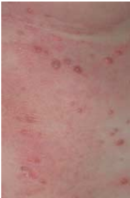
Abb. 2 Detailansicht der Blasen.