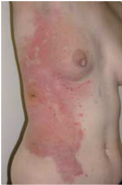
Abb. 1 Ausgeprägtes urtikarielles Infiltrat der rechten Flanke mit einzeln stehenden, prallen Blasen.