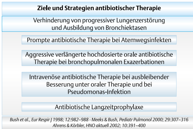
Abb. 3 Ziele der systemischen Antibiotikatherapie der pulmonalen Beteiligung bei primärer Ziliendyskinesie.

Die meisten Patienten mit primärer Ziliendyskinesie sind von bakteriellen Infektionen betroffen. Dabei geht es um drei verschiedene Organsysteme. Die chronische eitrig Otitis media betrifft mindestens 70% aller Patienten und kann zur Hörminderung und zur Sprachentwicklungsverzögerung führen. Mit mindestens 90% noch häufiger ist die chronische Rhinosinusitis. Eine chronische eitrig Lungenerkrankung wird ebenfalls bei mehr als 90% der Patienten beobachtet, wobei in 29–86% Bronchiektasen nachgewiesen werden. Ziel einer antibiotischen Therapie muss sein, diese Komplikationen zu verhindern (Abb. 3).