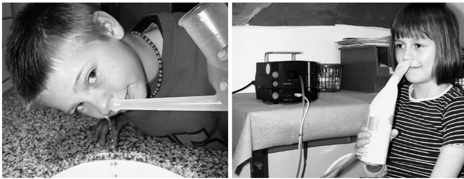
Abb. 1 Durchführung der Nasendusche (links) und Anwendung des Pari-Sole-Gerätes (rechts).