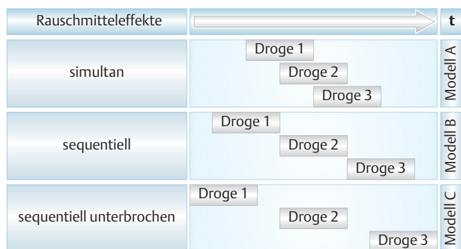
Abb. 1 Die verschiedenen Formen des polyvalenten Drogengebrauchs differenziert nach dem Grad der Überlappung ihrer Einzelwirkungen.

Ein weiteres Problem besteht darin, dass bestimmte Rauschmittel, wie z. B. Alkohol, von einer Vielzahl der Betroffenen nicht als Droge wahrgenommen oder, wie beim Cannabis, häufig eher zum „Herunterkommen“ in der Chill-out-Phase funktionalisiert werden. Damit rücken sie, unter dem Aspekt des Mischens von Rauschmitteln, nicht ins Blickfeld der Konsumenten [4].