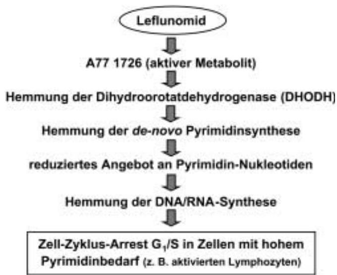
Abb. 3 Schematische Darstellung des Wirkmechanismus von Leflunomid. Über eine Hemmung des Enzyms Dihydroorotatdehydrogenase (DHODH) vermindert sich das Angebot an Pyrimidin-Nukleotiden, die für die Synthese von Nucleinsäuren benötigt werden. Dies hat in stark proliferierenden Zellen wie beispielsweise aktivierten Lymphozyten, die ihren erhöhten Bedarf an Pyrimidin-Nukleotiden nicht über den Salvage-Pathway decken können, einen Zellzyklus-Arrest zwischen der G1- und S-Phase zur Folge.

Wirksamkeit bei Patienten mit aktiver Rheumatoidarthritis als gleichwertig mit den Wirkstoffen Sulfasalazin [13] sowie Methotrexat [14]. In beiden genannten Studien fanden sich im Nebenwirkungsprofil vergleichbare Intensitäten zwischen Leflunomid und Sulfasalazin bzw. Methotrexat. Diese Daten konnten durch eine aktuelle Metaanalyse, in der sechs klinische Studien mit Einsatz von Leflunomid bei Rheumatoidarthritis ausgewertet wurden, bestätigt werden [15]. In einer kürzlich veröffentlichten Anschlussstudie an die oben erwähnte Vergleichsstudie mit Sulfasalazin zeigte sich Leflunomid hinsichtlich einer Verbesserung der klinischen Symptomatik der Patienten dem Sulfasalazin sogar deutlich überlegen [16]. Eine weitere klinische Studie zeigte die Möglichkeit einer Kombinationstherapie aus Leflunomid und Methotrexat bei Patienten mit aktiver Rheumatoidarthritis als effizient und von Seiten der Nebenwirkungen unproblematisch [17].