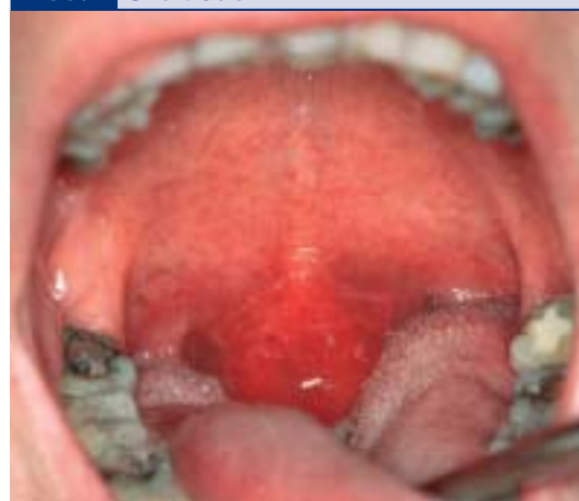
Abb. 1 Uvulaödem

Ein Peritonsillarabszess gehört unbedingt in fachärztliche stationäre Behandlung. Als Therapiemaßnahme steht neben intravenöser Antibiotikagabe die Punktion und die Abszessspaltung im Vordergrund. Bei Verdacht auf einen Retrotonsillarabszess oder bei insuffizienter Punktion ist umgehend die Tonsillektomie angezeigt.