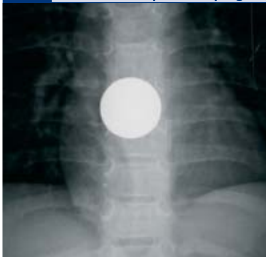
Abb. 5 Thoraxaufnahme a.p. mit metallischem Fremdkörper im Ösophagus