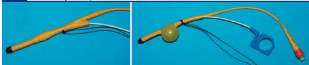
Abb. 4 Hintere Tamponade (nach Milewski, Fa. Rüsich)

Nasentamponade in geblocktem und ungeblocktem Zustand. Die Tamponade wird mit dem individuell gebogenen Führungsstab durch die Nase in den Epipharynx vorgeschoben, bis die schwarze Spitze neben der Uvula zu sehen ist. Nach Entfernen des Führungsstabes kann der Ballon geblockt und so platziert werden, dass er die Choanen verschließt.