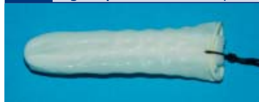
Abb. 3 Vordere Nasentamponade (Fingerlingtamponade, Fa. Stuemed)

sentamponade hin nicht zum Stehen, ist im Allgemeinen eine Einweisung in eine Fachklinik unumgänglich. Für diese Patienten wird häufig das Legen einer Bellocq-Tamponade notwendig, was für den Patienten weniger angenehm und belastend ist. Zum Legen einer Bellocq-Tamponade wird ein Gummikatheter von vorn durch die Nase am Nasenboden entlang geschoben, bis er im Rachen neben der Uvula erscheint. Er wird dort mit der Nasenzange gefasst und zum Mund herausgezogen. Die beiden Fäden des Bellocq-Tampons werden an den herausgeleiteten Katheterenden angeknüpft. Anschließend wird der Gummikatheter zurückgezogen und die beiden Fäden zur Nase herausgezogen. Damit gelangt der Tampon in den Mund. Durch Zug an den Fäden und begleitender Manipulation mit Zeige- und Mittelfinger wird der Tampon in den Nasenrachenraum manövriert, so dass er hinter der Uvula den Epipharynx tamponiert. Anschließend erfolgt die vordere Nasentamponade. Beide Fäden des Bellocq-Tampons werden über einen Tupper als Widerlager verknötet. Es ist darauf zu achten, dass die Fäden nicht über der Columella verknötet werden, da hier sonst leicht Druckschäden entstehen.