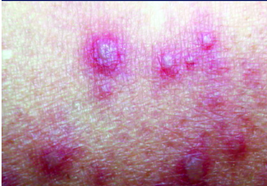
Abb. 3 Akuter Herpes Zoster erfordert Prävention der Schmerzchronifizierung