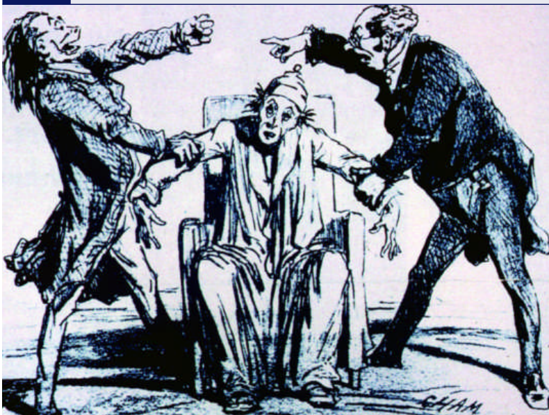
Abb. 4 Zwei streitende Koryphäen über einem ratlosen Patienten

Ungeachtet aller Erkenntnisse über Wirkmechanismen von Opioiden ist auch heute noch der Einsatz dieser Substanzgruppe überwiegend von Unkenntnis und längst widerlegten Vorurteilen geprägt. Anders lässt sich der im Vergleich zu anderen Industrienationen in Deutschland immer noch marginale Morphinverbrauch nicht begründen (Abb. 5). Nicht einmal die Tatsache, dass es sich bei Morphin um ein reines Phytopharmakon handelt, hat seine Akzeptanz wesentlich erhöht. Dabei steht heute mit einer Vielzahl natürlicher und halb-, beziehungsweise vollsynthetischer \mu -Agonisten eine breite Auswahl von Substanzen zur Verfügung, die eine individuelle Opioidtherapie ermöglichen. Bei richtigem Einsatz, das heißt Gabe retardierter Substanzen, Ermittlung der individuellen Dosis und des indi-