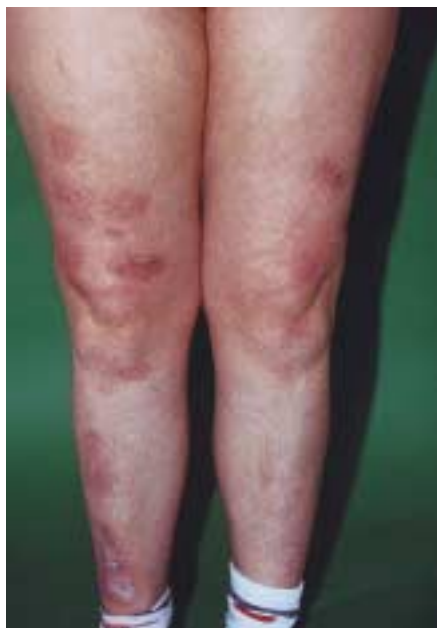
Abb. 5 Nach Abheilung Ausbildung atropher Narben.

fiel. Für eine glomeruläre Filtrationsstörung oder eine Nephritis bestanden keinerlei Anhaltspunkte. Auch andere klinische Untersuchungen (Echokardiographie, EEG, Abdomensonographie, ophthalmologische Untersuchung) waren unauffällig. Insgesamt gab es somit keinerlei Hinweise für das Vorliegen einer systemischen Vasculitis.