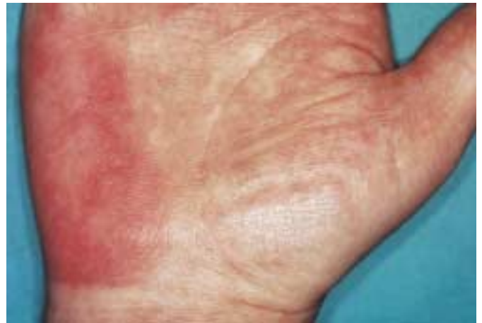
Abb. 2 Palmarerythem.