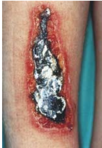
Abb. 4 Scharf begrenzte umschriebene Nekrosen am rechten Unterschenkel.

Eine Harnwegsinfektion mit Enterobacter amnigenus war schwer zu behandeln, da im Antibiogramm eine Penizillin- und Cephalosporin-Resistenz vorlag. Nur gegenüber Imipenem und