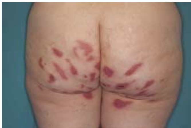
Abb. 1 Flagellatenförmige Erytheme der Glutealregion.

Bis auf einzelne Exkorationen über dem Os sacrum war das übrige Integument hauterscheinungsfrei. Hautveränderungen und Gelenksbeschwerden ließen uns an eine Kollagenose denken. Wir leiteten daraufhin eine ausgedehnte klinische, laborchemische immunologische und apparative Diagnostik ein.