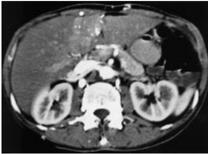
Abb. 4 Venae paraumbilicales im Ligamentum teres hepatis bei Verschluss der Vena cava superior.

der Thorax- und Bauchwand, hier bestand ein kräftiger Kollateralkreislauf über die Venae thoracicae internae, Venae epigastricae superiores und schließlich über die Venae paraumbilicales zur Vena portae. Im Segment 4a der Leber resultierte ein kräftiger Kontrastmittelstrom mit segmentalem Enhancement (Abb. 4).