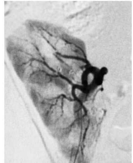
Abb. 4 i.a. DSA nach erfolgreicher Embolisation der Fistel mittels Microcoils. In der arteriellen Phase nun keine frühe Darstellung der Nierenvene. Nephrogramm ohne größere Infarzierungen. Kaliberunregelmäßigkeiten der Aa. lobares und interlobares i.S. der chronischen Abstoßungsreaktion.

Nach unseren Kenntnissen handelt es sich im vorliegenden Fall um eine erstmalige Fallvorstellung in der deutschsprachigen Literatur. In der internationalen Literatur findet sich bisher lediglich ein ähnlicher Fallbericht (Bagga et al, Am J Roentgenol 1999; 172: 1509). Die Zuordnung der Gefäße im Detail gelingt in der Regel nur in der Betrachtung der Einzelschichten. Dies betrifft im vorgestellten Fall auch insbesondere die Differenzierung zwischen den stark geschlängelt verlaufenden Arterien und Venen bei zeitgleicher KM-Anreicherung durch den Shunt. Die MIP-Rekonstruktionen dienen hauptsächlich zur über-