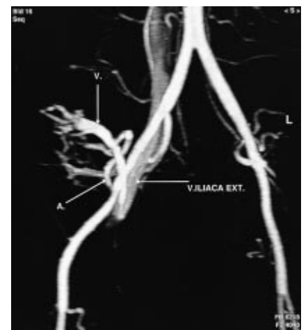
Abb. 2 MIP-Rekonstruktion der kontrastverstärkten MRA, arterielle Phase. Übersichtliche Darstellung von Arterie (A.) und shuntgespeister Vene (V.) sowie deren Anastomosen mit den Iliacal-Gefäßen.