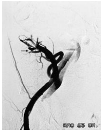
Abb. 3 i.a. DSA in ähnlicher Projektion wie Abb. 2. Die schnelle Bildfolge sichert den Fistelsteg in einem Nierenarterienast 2. Ordnung (Pfeil). Fehlendes Nephrogramm.

Die Häufigkeit von iatrogenen AV-Fisteln nach Punktionen von Transplantatnieren wird zwischen 0,9 und 15% angegeben (Dorffner et al, Cardiovasc Intervent Radiol 1998; 21: 129). Viele dieser Fisteln bleiben asymptomatisch und verheilen nach Literaturangaben zu 33 – 90% spontan (Harrison et al, J Am Soc Nephrol US 1994; 5: 1300). Einige können jedoch zu schwerwiegenden Folgen in Form von Niereninsuffizienz, Blutungen, Hämaturie, Hypertonie oder Herzinsuffizienz führen. Die Diagnose kann oft anhand der Duplexsonographie sicher gestellt werden (Mutze et al, Pediatr Radiol 1997; 27: 898). Andere Untersuchungsmethoden werden notwendig, falls die Duplexsonographie keine sichere Diagnose ergibt, oder falls die Indikation zur Therapie (Operation oder Intervention) besteht. Die kontrastmittelunterstützte MRA in der oben dargestellten Technik