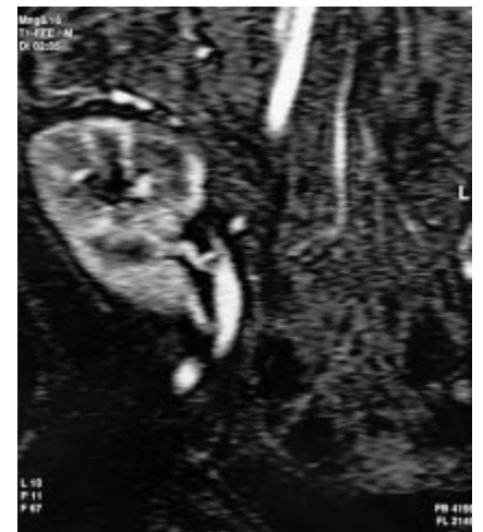
Abb. 1 Einzelschichten der Kontrastmittel-MRA in koronarer Schnittrichtung. In der arteriellen Phase (a) zeitgleiche Füllung von Arterie und Vene bei fehlender Parenchymperfusion. Erst in der späteren Phase (b) Darstellung der Transplantatniere.