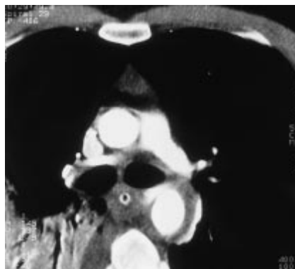
Abb. 3 Infrakranialer Axialschnitt mit Darstellung des Kontrastmittelparavasats und gedeckter Ruptur bei Dissektion der Aorta descendens thoracalis. Mediastinalhämatom.