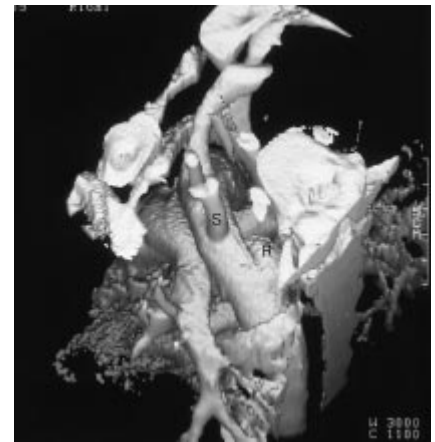
Abb. 4 Oberflächenrekonstruktion aus dem mit 1 mm Inkrement nachberechneten Spiral-Datensatz. Darstellung der nach dorsal und lateral gerichteten, im hinteren Mediastinum gelegenen gedeckten Ruptur (R) der Aorta descendens thoracalis distal des Abgangs der A. subclavia sinistra (S).

Autoptisch bestätigte sich eine 3,5 cm lange, quer verlaufende, gedeckte Ruptur am Übergang des Arcus aortae zur Aorta descendens distal des Abgangs der Arteria subclavia bis in das adventitielle Bindegewebe. Im Perikard und im Mediastinum befanden sich zum Obduktionszeitpunkt 80 ml hämorrhagische Flüssigkeit. Intrakraniell waren bei Schädelbasisfraktur beidseitig epidurale Hämatome, temporale zerebrale Kontusionsherde und ein Hirnödem nachweisbar.