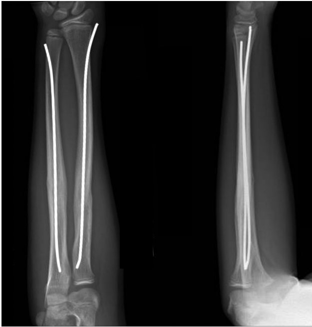
Fig. 2 Radiografia anteroposterior e em perfil aos 6 meses acompanhamento.

completa. As radiografias são obtidas em intervalos de 6 semanas para avaliação da consolidação e os pinos são normalmente removidos entre 9 e 12 meses (→ Fig. 2).