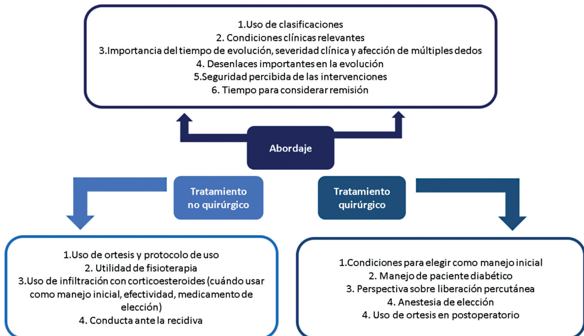
Gráfica 1 Estructura de la encuesta administrada a los cirujanos de mano colombianos agremiados.

Para 2021, 154 cirujanos de mano se encontraban agremiados en Colombia, por lo que este estudio logró