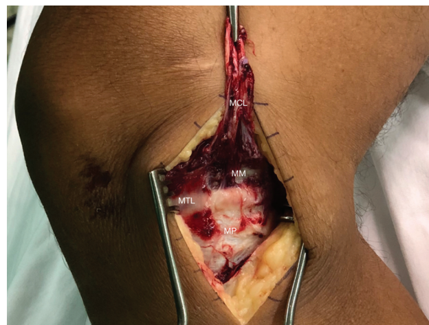
Fig. 3 Acesso para exérese dos LMTs mediais. Terceira camada medial do joelho. O ligamento colateral medial foi deslocado em sentido proximal para permitir a visualização do menisco medial e do LMT medial (inserido). (MCL: Ligamento colateral medial; MTL: Ligamento meniscotibial; MP: Platô medial; MM: Menisco medial).

superficial sobrejacente na região próxima à fixação cefálica. A porção meniscotibial do LCM profundo, no entanto, é imediatamente separada do LCM superficial sobrejacente e é chamada de ligamento coronário; ou seja, é parte do próprio LMT medial. Assim, a identificação do LCM profundo é uma excelente referência para encontrar o LMT medial e suas inserções meniscais e tibiais (►Fig. 3).