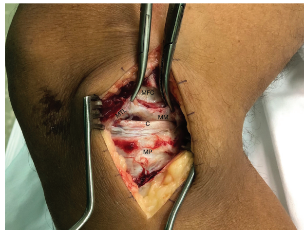
Fig. 4 Acesso para exérese dos LMTs mediais. Terceira camada medial do joelho. Inserção do LMT medial (deslocado em sentido proximal). (MTL: Menisco tibial medial; MM: Menisco medial; MFC: Côndilo femoral medial; MP: Platô medial; C: Cartilagem).

O LMT medial foi encontrado em todos os 20 joelhos estudados conforme a técnica mencionada. Em nossa amostra, o LMT medial apresentou comprimento médio de