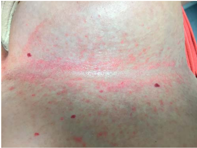
► Abb. 8 Langerhanszell-Histiozytose, Hautbefund submamitär links 9 Monate nach Beginn der Therapie mit Methotrexat.