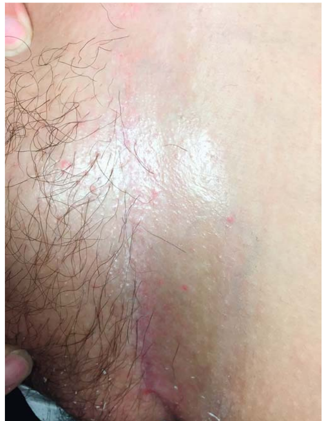
► Abb. 7 Langerhanszell-Histiozytose, Hautbefund inguinal links 9 Monate nach Beginn der Therapie mit Methotrexat.

Die Langerhanszell-Histiozytose (LCH), früher auch Histiozytosis X genannt, ist durch eine Proliferation histiozytärer Zellen in verschiedenen Geweben gekennzeichnet. Im Kindesalter beträgt die Inzidenz 3–5/1 000 000 jährlich. Bei Erwachsenen tritt das Krankheitsbild deutlich seltener auf [1].