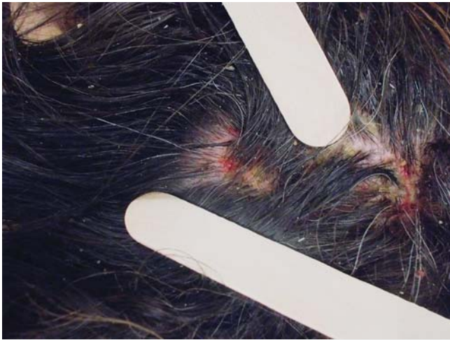
► Abb. 1 Großflächig konfluierende Erytheme mit schmerzhaften, teils krustös belegten, gruppiert stehenden Papeln am Kapillitium bei Langerhanszell-Histiozytose.