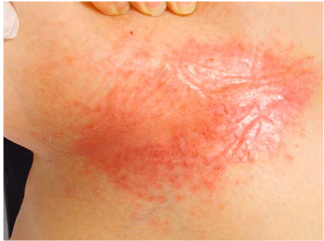
► Abb. 3 Scharf begrenztes, glänzendes Erythem mit peripher folliculär gebundenen Papeln submammär rechts bei Langerhanszell-Histiozytose.