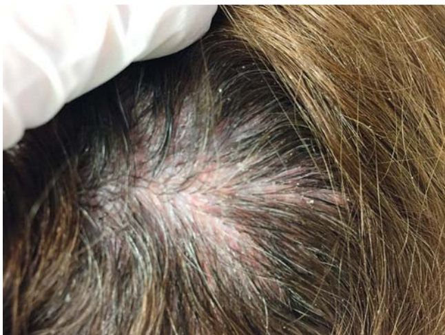
► Abb. 9 Langerhanszell-Histiozytose, Hautbefund Kapillitium 9 Monate nach Beginn der Therapie mit Methotrexat.

Die proliferierenden dendritischen Zellen unterscheiden sich ultrastrukturell nicht von Langerhanszellen der Epidermis und exprimieren demnach ebenfalls den Haupthistokompatibilitätskomplex CD1a. Als Pathomechanismus wird eine Zytokinimbalance zwischen T-Zellen und Langerhanszellen beschrieben, die zu einem interzellulären Kommunikationsdefekt führt. Die Ätiologie ist bisher nicht bekannt [10]. Vor wenigen Jahren wurde entdeckt, dass ein Großteil der LCH-Zellen eine BRAF-Mutation aufweist. Eine neoplastische Genese ist demnach wahrscheinlich und ist derzeit Gegenstand aktueller Studien [9].