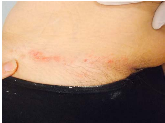
► Abb. 4 Vereinzelte Erosionen auf scharf begrenzten Erythemen inguinal links bei Langerhanszell-Histiozytose.