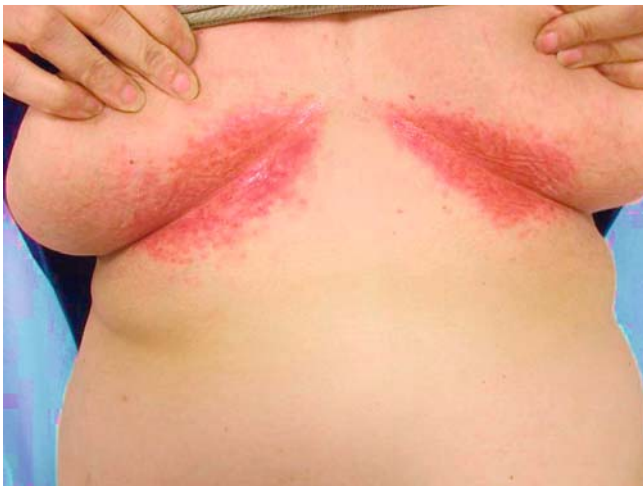
► Abb. 2 Scharf begrenzte Erytheme submammär beidseits bei Langerhanszell-Histiozytose.