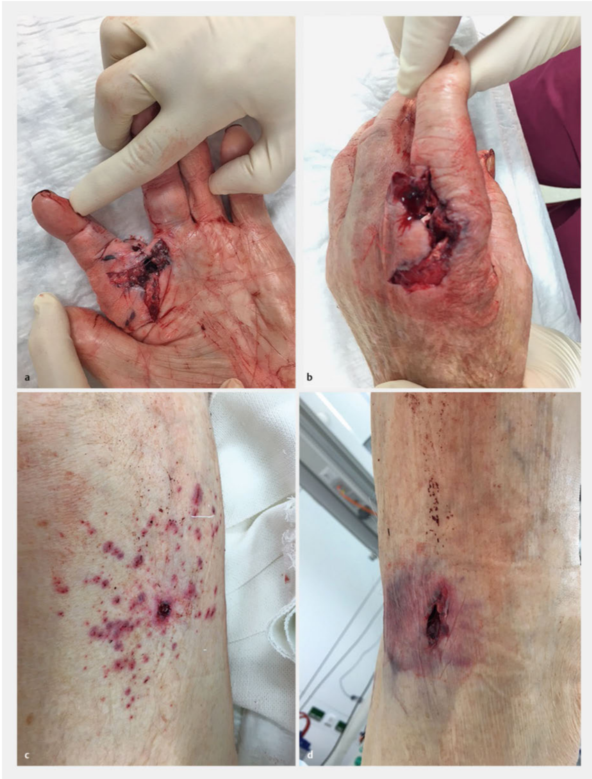
► Abb. 2 Schussverletzung durch eine Pistole mit Munition aus dem 2. Weltkrieg. a Einschuss an der linken Hand. b Ausschuss an der linken Hand. c Wiedereintritt des Projektils am linken Oberschenkel mit Blutsprengeln aus der Handaustrittswunde der Hand um den Wiedereintritt herum. d Austrittswunde am linken Oberschenkel.