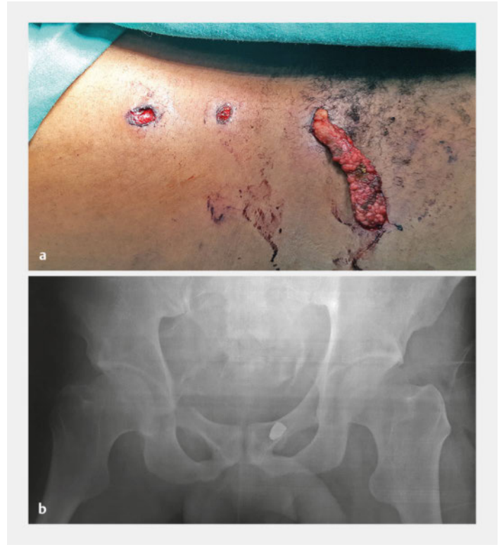
► Abb. 3 Schussverletzung durch eine Pistole am rechten Unterbauch. Verletzt war die Blase durch einen Durchschuss, bei dem das Projektil intraperitoneal ohne weitere Verletzung verlief, das Peritoneum am rechten Blasendach durchdrang, die Blase durchschlug und letztendlich am vorderen Beckenring hängen blieb. a Zwei nah aneinander liegende Einschusswunden sowie einer Ausschusswunde mit sichtbarem prolabiertem Omentum. b Nachweis des Projektils am Beckenknochen bei fehlendem 2. Ausschuss.

Offene Thoraxverletzungen sind unverzüglich mit luftdichten Verbandmitteln zu schließen. Die Entlastungspunktion mittels großkalibriger Nadel im 2. Interkostalraum (ICR) medioklavikular (Monaldi-Position) stellt eine einfache und schnell durchzuführende, aber temporäre Maßnahme dar, bis eine Minithorakotomie mit Einlage einer Thoraxdrainage in Büllau- (4. ICR vordere Axillarlinie) oder Monaldi-Position (2. ICR medioklavikular) erfolgen kann. Die zur Entlastungspunktion verwendete Kanüle benötigt bei Anwendung im empfohlenen 2. ICR medioklavikular mindestens eine Länge von 64 mm, d. h. die Venenverweilkanülen mit 16 und 14 G (Stichlänge 50 mm) reichen u. U. nicht aus, um den Pleuraraum sicher zu erreichen [38]. Kann der Pleuraraum mit der zur Verfügung stehenden Punktionsnadel nicht sicher erreicht werden, muss unverzüglich eine Minithorakotomie erfolgen.