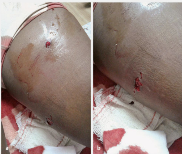
► Abb. 5 Unkomplizierter Durchschuss am linken Oberschenkel durch eine Faustfeuerwaffe. Nach Ausschluss von Gefäßverletzungen erfolgten eine Single-Shot-Antibiose sowie eine konservative Therapie. a Einschuss ventral. b Ausschuss dorsomedial.

mit Schädel-Hirn-Trauma keine Anwendung finden. Aktuelle Untersuchungen deuten darauf hin, dass bei Patienten mit penetrierenden Verletzungen und einem systolischen Blutdruck unter 110 mmHg die Letalität steigt [41]. Instabile Beckenfrakturen sollen durch Anlage einer Beckenschlinge komprimiert und frakturierte Extremitäten geschient werden, um den Blutverlust zu reduzieren.