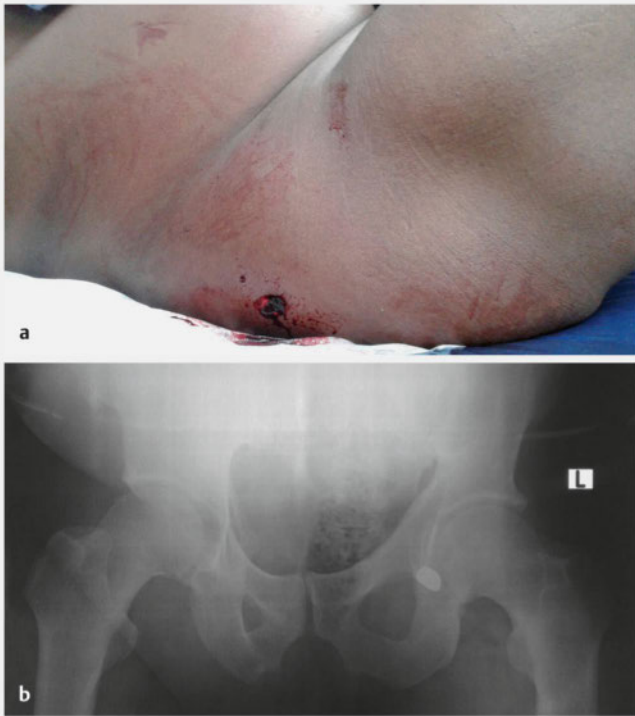
► Abb. 4 Vollständig extraperitoneal verlaufende Schussverletzung. Durch diesen Schuss war die Harnblase am Blasenhals durchschlagen worden. a Einschuss im Bereich des rechten Gesäßes ohne Nachweis eines Ausschusses. b Nachweis des Projektils am vorderen linken Beckenring.