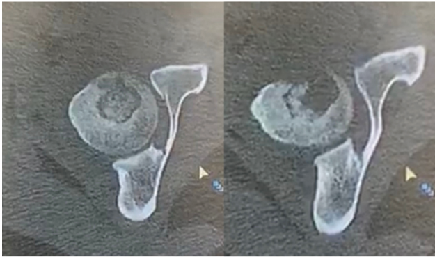
Fig. 3 Imagens axiais iniciais da tomografia computadorizada demonstrando erosão cortical e lesão cavitária.