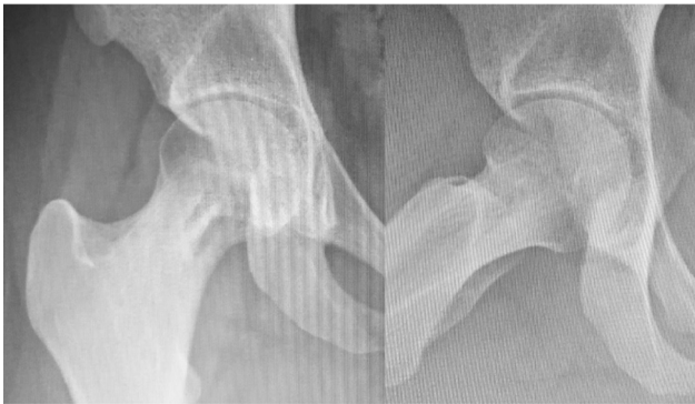
Fig. 4 Radiografia realizada 180 dias após a cirurgia demonstrando formação óssea na lesão anterior.

Foi realizado tratamento endovenoso com anfotericina B por 2 semanas, e a paciente evoluiu com melhora completa da dor articular. Assim, a decisão médica foi de tratamento clínico da osteomielite seguido por fluconazol via oral por 6 meses.