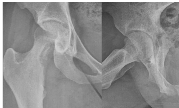
Fig. 1 Radiografia inicial demonstrando lesão osteolítica no colo do fêmur. AP à esquerda e lateral à direita.

Houve evolução com melhora do quadro álgico e da febre. Nas culturas, não se evidenciou crescimento bacteriano, mas o exame anatomopatológico revelou estruturas leveduriformes que podem corresponder a Cryptococcus , indicando diagnóstico de osteomielite fúngica.