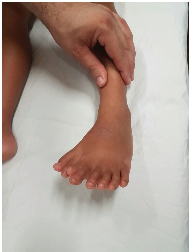
Fig. 1 Aspecto clínico pré-operatório do pé em espelho.

estigmas sociais, a possibilidade de uso de calçados fechados e a melhora estética do pé.