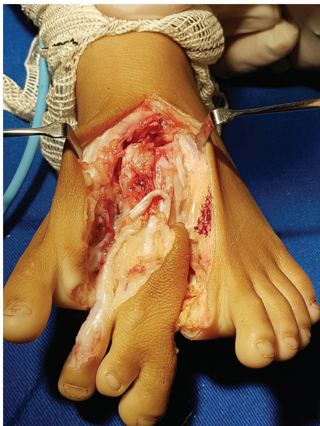
Fig. 3 Ressecção em cunha de raios e ossos extranumerários.

submetidos a tratamento cirúrgico, porém sem padronização nas abordagens. As estratégias adotadas na maioria dos casos visavam a obtenção de um pé funcional, com apresentação estética satisfatória.