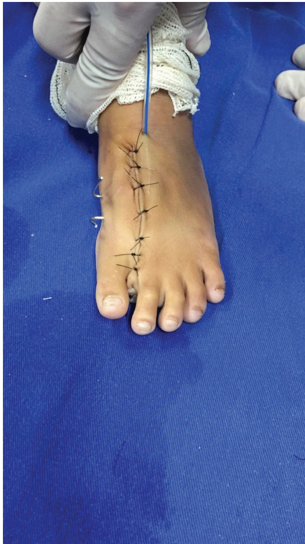
Fig. 5 Aspecto clínico pós-operatório.

série de casos com 22 pacientes e 27 pés com polidactilia central.