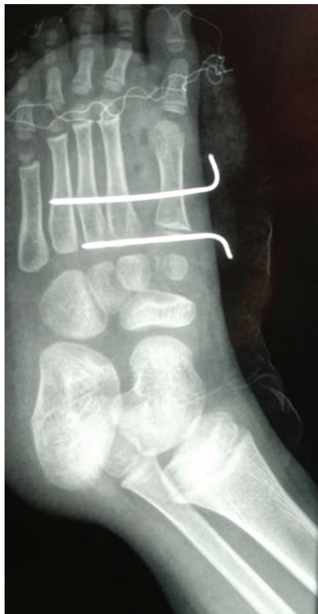
Fig. 4 Aspecto radiológico pós-operatório imediato.

Shahcheraghi et al. 5 relataram o tratamento de dois casos de pé em espelho centrais nos quais ambos tiveram os raios centrais e excesso de pele removidos, sendo que em um deles a aproximação dos demais metatarsos foi feita por meio de cerclagem com fio de aço 1,0 e sutura com fio absorvível. No outro caso, a aproximação dos raios foi mantida mediante a inserção de um pino metálico com as extremidades lateral e medial dobradas para oferecerem contenção ao alargamento do antepé. Neste trabalho, após a ressecção dos três raios centrais e das duas cunhas excedentes, optamos pela fixação transmetatarsiana do primeiro ao quarto raios com fios de Kirschner para a estabilização destes e cicatrização de partes moles.