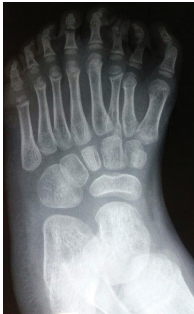
Fig. 2 Aspecto radiológico pré-operatório do pé em espelho.

O procedimento foi realizado em centro cirúrgico, com a paciente posicionada em decúbito dorsal, sob raquianestesia, com coxim lateral e torniquete pneumático no nível da coxa inflado a 300 mmHg. Foram realizadas incisão de pele dorsal e plantar em “V” centrada no meio do pé (►Fig. 3), dissecação por planos e ressecção do segundo, terceiro e quarto metatarsos e de suas falanges, e do segundo e terceiro cuneiformes, seguidas de flap de retalho em cunha. A remoção do segundo dedo do pé do lado medial significava uma ruptura inevitável do ligamento de Lisfranc. Após hemostasia, realizou-se redução da largura do antepé, com aproximação dos metatarsianos e fixação com 2 fios de Kirschner de 1,5 mm paralelos, inseridos a 90° a partir do primeiro metatarsiano, e evitou-se transfixar a fise de crescimento. Foi feita a checagem do posicionamento dos fios de Kirschner (►Fig. 4) e procedeu-se com a sutura dos ligamentos intermetatarsianos com fio absorvível. Instalou-se dreno de sucção e fez-se a síntese por planos com fio