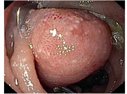
► Abb. 3 Applikation eines 14 mm OTSC Typ a mit effektiver langfristiger Hämostase.