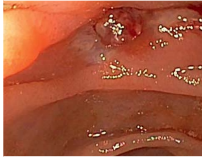
► Abb. 2 Pulsierende Dieulafoy-Läsion im distalen Jejunum (Forrest IIa).