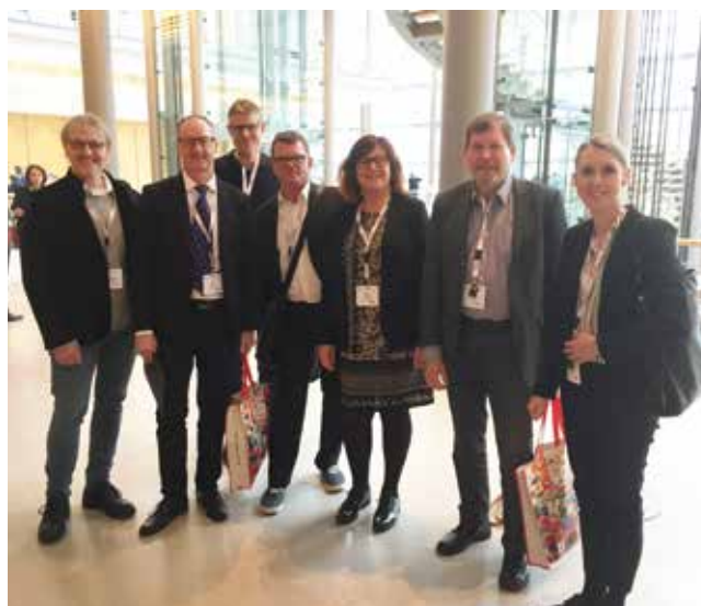
Danske deltagere til EUROSON