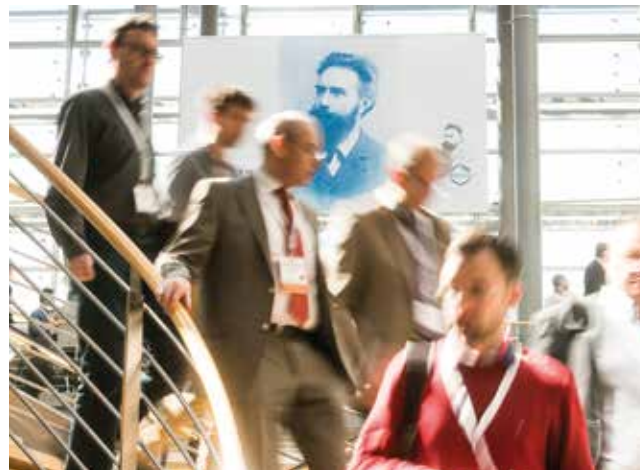
Der 97. Deutsche Röntgenkongress 2016 im Congress Center Leipzig