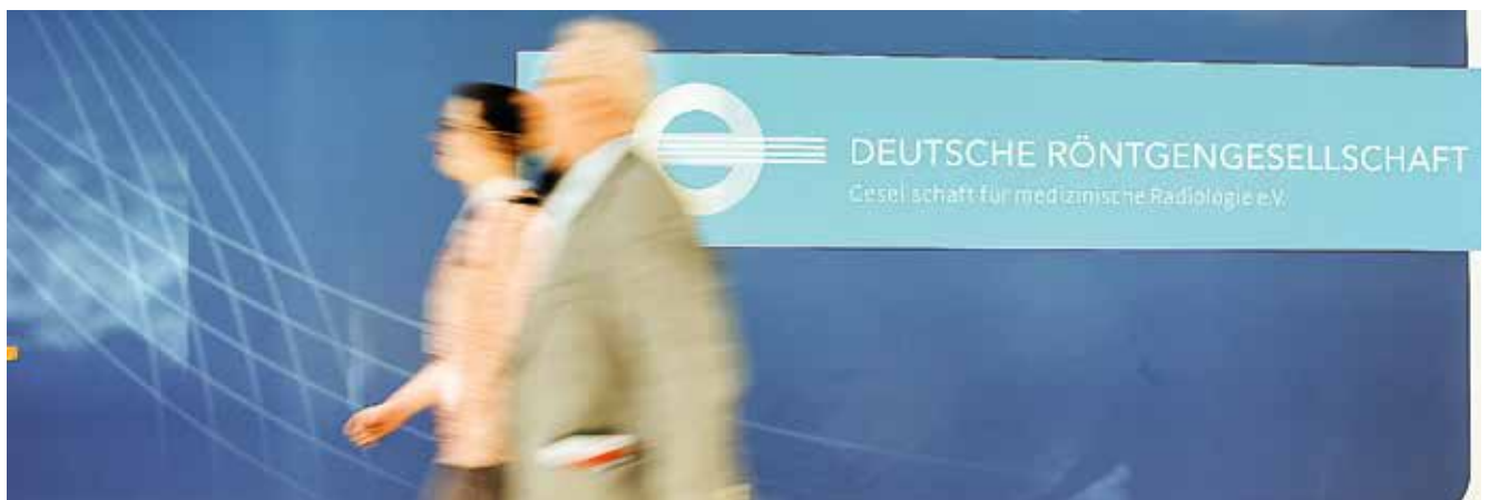
Eine gelungene Premiere in Leipzig: der 97. Deutsche Röntgenkongress