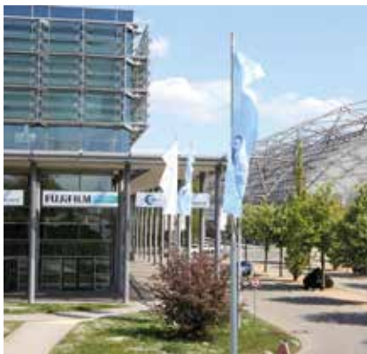
Die neue Heimat des Deutschen Röntgenkongresses, das Congress Center Leipzig

Neben den etablierten Formaten der Wissensvermittlung wie Refresher- und Zertifizierungskursen, Spezialkursen, Symposien und wissenschaftlichen Vorträgen lag ein besonderer Fokus auf interaktiven und praxisnahen Veranstaltungen. Hierzu zählten zahlreiche Workshops, in denen