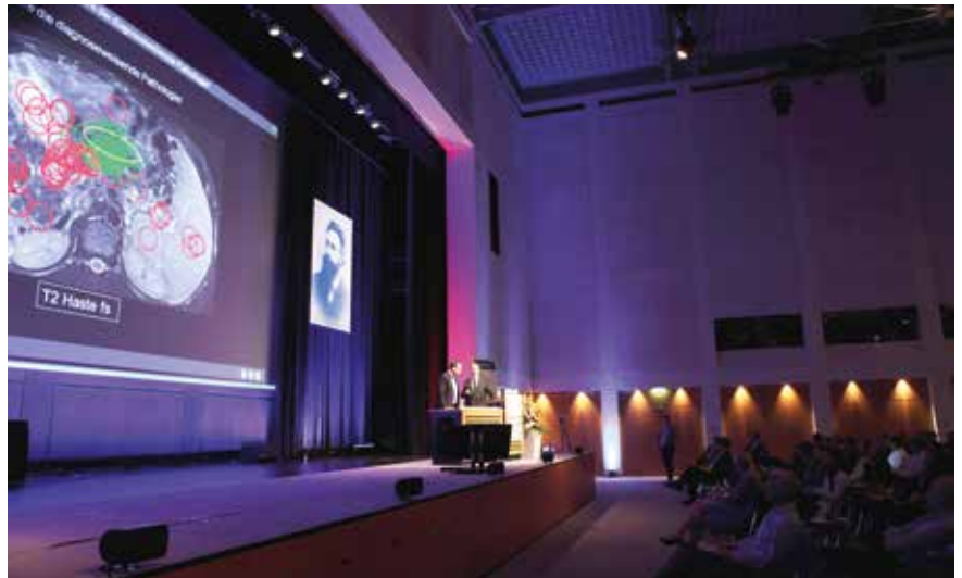
Die Fit-für-den-Facharzt-Kurse waren gut besucht