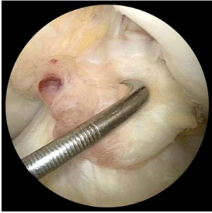
Abb. 4 Proximale vordere Kreuzbandruptur.