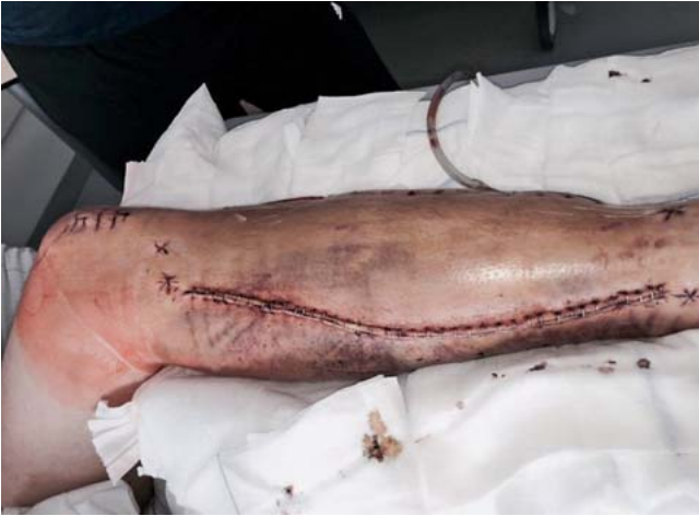
Abb. 1 Kompartmentsyndrom nach Fraktur.