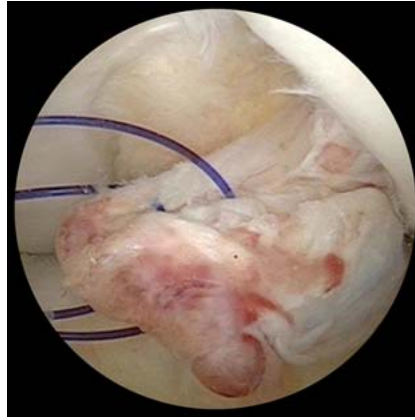
Abb. 5 Fassen des vorderen Kreuzbandstumpfs durch Naht.