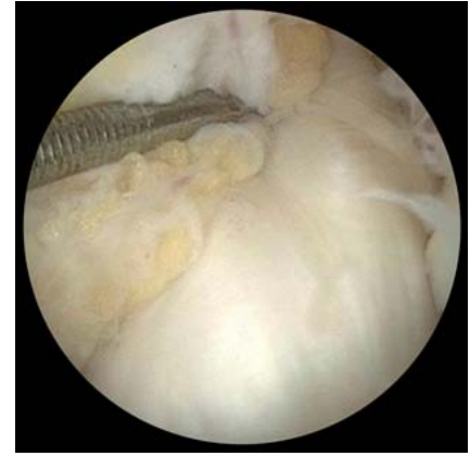
Abb. 6 Vorderes Kreuzband nach Refixation durch Naht und Augmentation.

ben. Bei Rupturen im proximalen Drittel verbleiben oft kräftige und lange tibiale Reste.