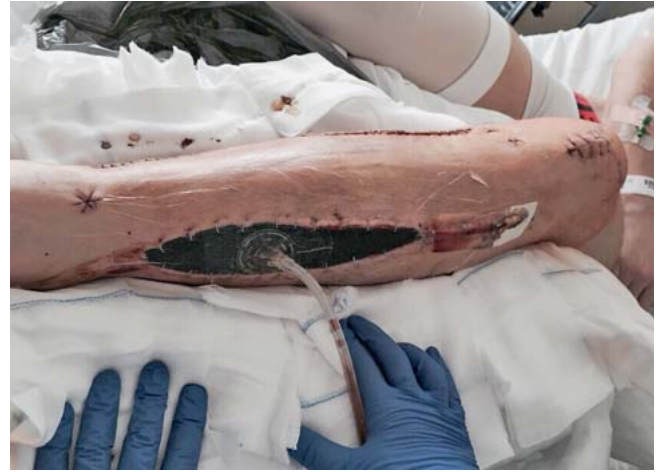
Abb. 2 Kompartmentsyndrom bei einem Sportler.

Generell wird beim Leistungssportler im Falle einer Knieverletzung mit einer OP-Indikation aber schon eine frühzeitige Operation angestrebt.