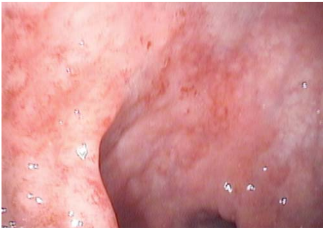
Abb. 1 Proktitis bei flex. Endoskopie.