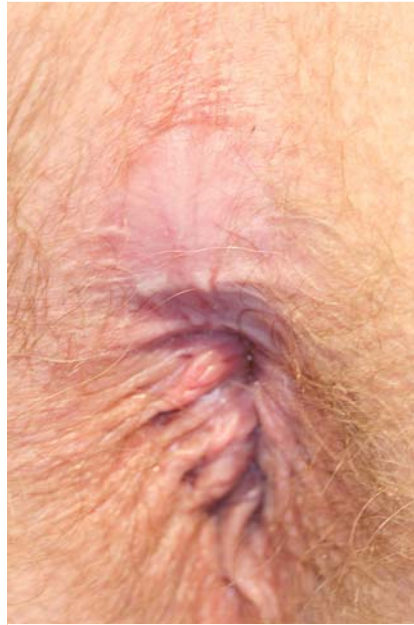
Abb. 4 Angestrebtes Remodelling mit Wiederherstellung der Oberflächenkontur nach ungestörter Sekundärheilung.

Unter diesem Aspekt sollen nun die wichtigsten proktochirurgischen Krankheitsbilder mit ihren speziellen Anforderungen dargestellt werden. Hierbei ist eine Unterscheidung zwischen exzidierenden und rekonstruierenden Operationsverfahren und eine differenzierte Betrachtung von Wunden der perianalen Haut mit ihren Anhangsgebilden gegenüber Wunden mit Bezug zum mit Anoderm ausgekleideten Analkanal sinnvoll.