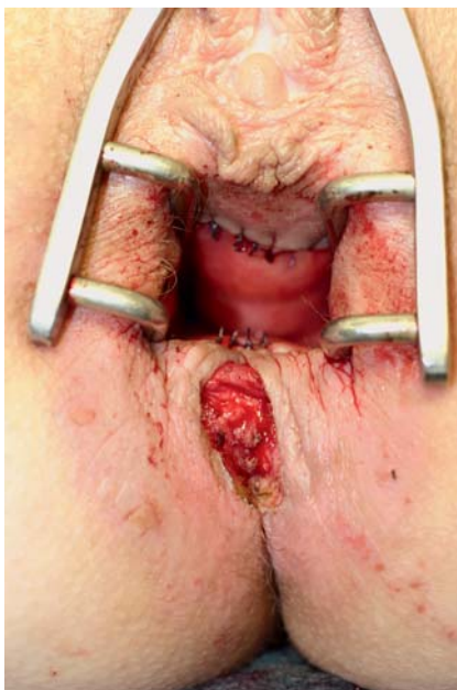
Abb. 9 Drainagesicherung einer zirkulären Rekonstruktion des Analkanals durch Anoderm-Verschiebelappenplastik.