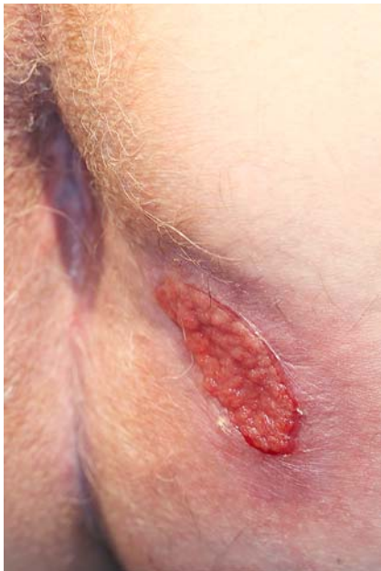
Abb. 10 Saubere Granulationen nach ovalärer Abszessfreilegung.