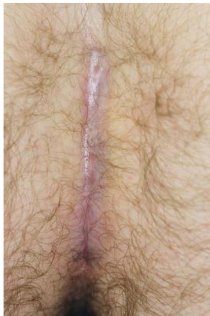
Abb. 6 Ausheilungsergebnis nach offener Exzision eines Pilonidal-sinus.