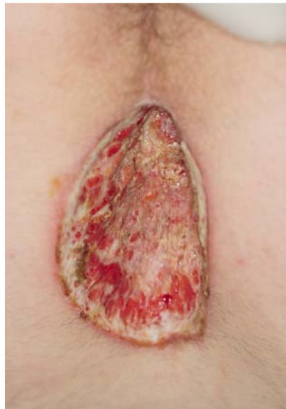
Abb. 5 Schichtgerechte Exzision eines Sinus pilonidalis unter Vermeidung von unterminierenden Wundrändern und Respektierung der Präsakralfaszie.