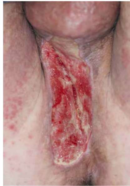
Abb. 1 Überfeuchtungsdermatitis nach Exzision einer Akne inversa und unzureichender Wundbehandlung.

Trotz dieser langen Heilungszeiten trifft die ansonsten übliche Definition zur Abgrenzung akuter von chronischen Wunden die proktologisch besondere Situation nicht sinnvoll, da anders als bei den von der Definition üblicherweise berücksichtigten Entitäten (diabetisches Fußsyndrom, Ulcus cruris, Dekubitus und sekundäre Wundkomplikationen) in der Regel keine ursächliche Mangel durchblutung vorliegt, sodass eine Heilung auch ausgehnter, offen belassener Wunden trotz unabwendbar stetiger Stuhlkontamination hier möglich ist und eine Heilungszeit über 12 Wochen hinaus nicht automatisch eine Komplikation anzeigt. Ohne wissenschaftliche Evidenz hat sich folgendes, auch in den Empfehlungen des Berufsverbandes der Koloproktologen Deutschlands dargestellte Vorgehen [9] zur Versorgung der prok-