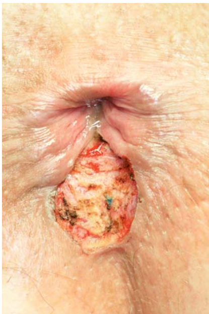
Abb. 8 Ausreichend über die Sphinkterkante hinaus dimensionierte Drainagewunde.