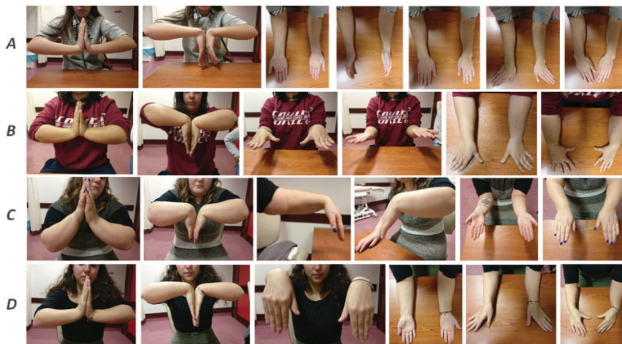
Fig. 6 Fotografia clínica da mobilidade pós-operatória do punho e antebraço. A – paciente com procedimento cirúrgico bilateral; B – paciente com procedimento cirúrgico bilateral; C – paciente com procedimento cirúrgico à esquerda; D – paciente com procedimento cirúrgico à direita.

Abreviações: \Delta , variação; DASH, disabilities of the arm, shoulder and hand; EVA, escala visual analógica.