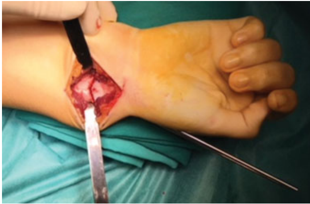
Fig. 4 Realização da osteotomia em cúpula de concavidade distal da região metafisária do rádio distal com osteótomos curvos.

fragmento proximal. É feito o controle fluoroscópico da redução e fixação alcançadas (► Figura 5 ). Dobram-se e cortam-se os fios K, deixando fora da pele uma extremidade que permita a sua remoção na consulta. Realiza-se profilaticamente uma fasciotomia volar limitada e inicia-se o encerramento reaproximando parcialmente o retalho do pronator quadratus com fio absorvível. Encerra-se o tecido celular subcutâneo e a pele com fio absorvível. Realiza-se uma imobilização gessada antebraquial, que se bivalva no bloco operatório, prevenindo o risco de edema/síndrome compartimental pós-cirúrgicos.