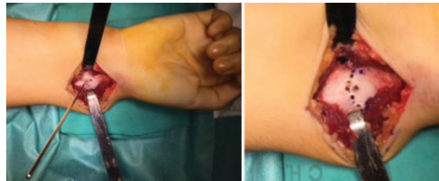
Fig. 2 Fenestração em cúpula de concavidade distal do córtex volar e dorsal da região metafisária do rádio distal com fio de Kirschner (1.6 mm).

Realiza-se uma abordagem volar do rádio através de uma incisão longitudinal ( \pm 7 cm), explorando o espaço entre o flexor carpi radialis e a artéria radial. Identifica-se o músculo pronator quadratus e eleva-se um retalho em "L" de base distal para exposição da face volar do rádio. Identifica-se o ligamento de Vickers, que é seccionado e excisado ( Figura 1 ). Sob observação direta e apoio de fluoroscopia, identifica-se a região metafisária do rádio a osteotomizar, evitando lesar a articulação radiocubital distal e a fise distal do rádio (quando presente). Realiza-se uma disseção subperiosteal circunferencial do rádio e, com um fio Kirshner (K) 1.2/1.6mm, inicia-se a fenestração em cúpula (de concavidade distal) do córtex da metáfise distal volar e dorsal do rádio ( Figura 2 ). Introduzem-se percutaneamente dois fios K de 2.0/2.4mm paralelos ou divergentes através da estilóide radial e orientados no sentido da região fenestrada da osteotomia, sem a ultrapassar ( Figura 3 ). Realiza-se a osteotomia em cúpula do rádio distal com osteótomos curvos ( Figura 4 ) e procede-se a uma manobra de redução com tração longitudinal, desvio radial, pronação e desvio dorsal do fragmento distal. Enquanto o cirurgião principal mantém a redução alcançada, o cirurgião ajudante avança os fios K através do foco da osteotomia até obter uma fixação cortical no