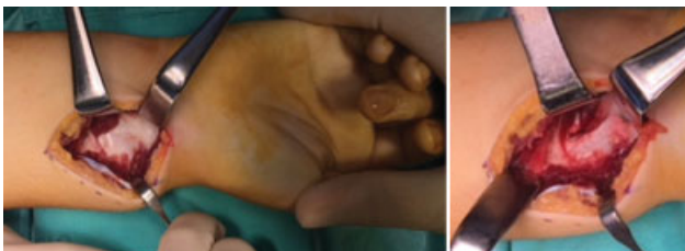
Fig. 1 Abordagem volar do rádio com identificação, secção e excisão do ligamento de Vickers.

Foram analisados os seguintes parâmetros: dados demográficos (gênero, idade de diagnóstico e lateralidade), idade à data da cirurgia, técnica cirúrgica, tempo de consolidação óssea e resultados radiográficos e clínicos. A avaliação radiográfica pré e pós-operatória foi realizada através da medição da inclinação ulnar, afundamento do semilunar, ângulo da fossa semilunar e desvio palmar do carpo. 14 Estas medições foram efetuadas através de exame radiográfico do punho e do antebraço (anteroposterior e perfil), realizado na nossa instituição. Considerou-se o raio-X pré-operatório como o mais próximo da data de cirurgia. A avaliação clínica pós-operatória foi realizada em consulta médica e consistiu na medição das amplitudes articulares do punho e do antebraço, na aplicação da escala visual analógica (EVA) (com avaliação da dor, do défice funcional, do impacto estético e da recomendação do procedimento cirúrgico) e do score Disabilities of the Arm, Shoulder and Hand (DASH, na sigla em inglês). 18 A realização do estudo é autorizada pela Comissão de Ética da Instituição Hospitalar e os pacientes e suas famílias assinaram o termo de consentimento informado.