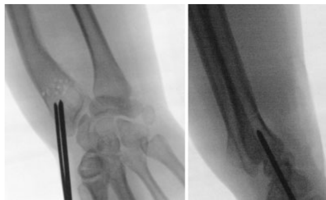
Fig. 3 Introdução de 2 fios de Kirschner (2.0/2.4mm) paralelos ou divergentes ao nível da estilóide radial e orientados no sentido da região metafisária do rádio distal previamente fenestrada, sem a ultrapassar.