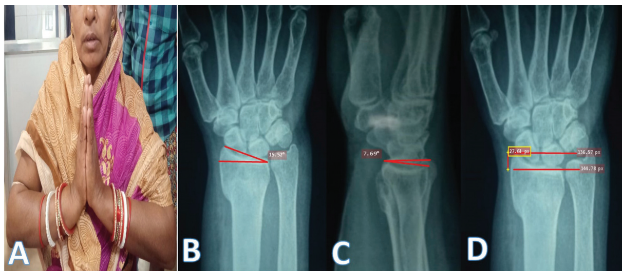
Fig. 3 Acompanhamento da fratura de Colles do pulso direito. (A) Quadro clínico; (B) inclinação radial; (C) inclinação dorsal; (D) altura radial.