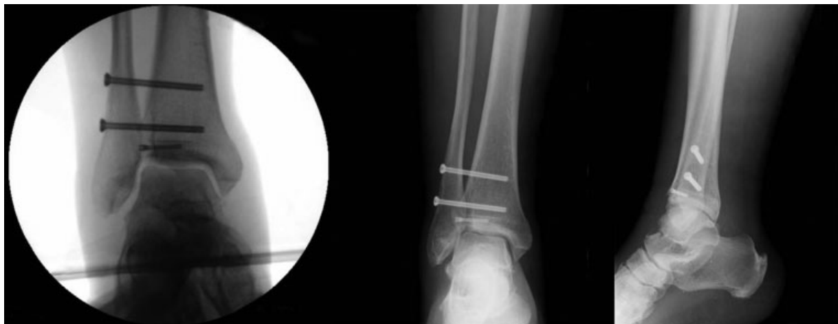
Fig. 4 Controle fluoroscópico intraoperatório – esquerdo; Radiografia pós-operatória – direita.