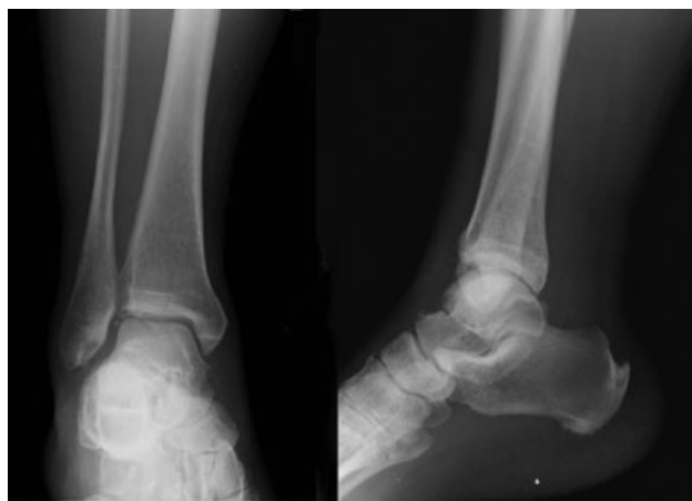
Fig. 1 Radiografia inicial padrão do tornozelo direito.

Sob anestesia geral, em posição supina e com torniquete aplicado à coxa proximal direita, o paciente foi submetido a artroscopia anterior do tornozelo através dos portais anteromedial e anterolateral padrão. Fibrose extensa estava presente. Após desbridamento e remoção do corpo frouxo, fraturas e lesões sindesmóticas foram facilmente visualizadas. A redução da fratura foi obtida sob visualização direta e fixada com um parafuso interfragmentar canulado de 3,0 mm, colocado através do portal anterolateral. A lesão sindesmótica foi reduzida e fixada com dois parafusos corticais trans-sindemóticos percutâneos de 4,5 mm. A exploração artroscópica após a fixação confirmou redução