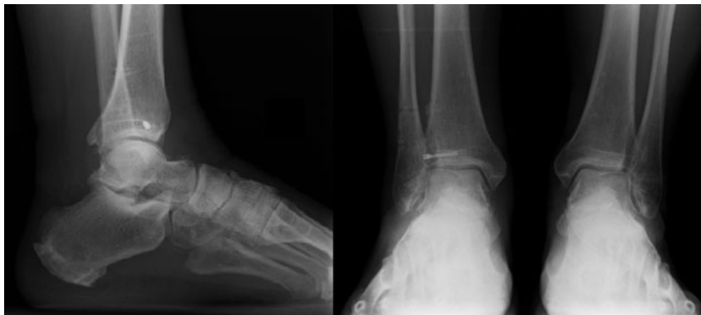
Fig. 5 Radiografia com suporte de peso aos 6 meses de acompanhamento.

Os fragmentos de fratura podem ser pequenos e podem não ser percebidos nas radiografias tradicionais do tornozelo, podendo ser necessárias incidências oblíquas. A tomografia computadorizada é mais precisa que as radiografias simples e permite uma melhor avaliação do deslocamento da fratura, padrão e congruência articular. 6