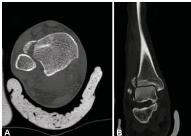
Fig. 2 Tomografia computadorizada de tornozelo direito. (A) Vista axial; (B) Vista sagital.

satisfatória, o que também foi confirmado com fluoroscopia (► Figs. 3 e 4 , vídeo 1). Nenhuma imobilização foi utilizada após a cirurgia, permitindo mobilização passiva e ativa precoce.