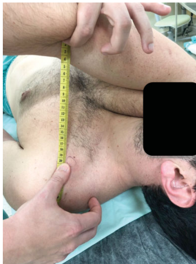
Fig. 2 Posição supina adotada durante o exame físico mostrando a distância entre o processo coracoide e a fossa cubital.