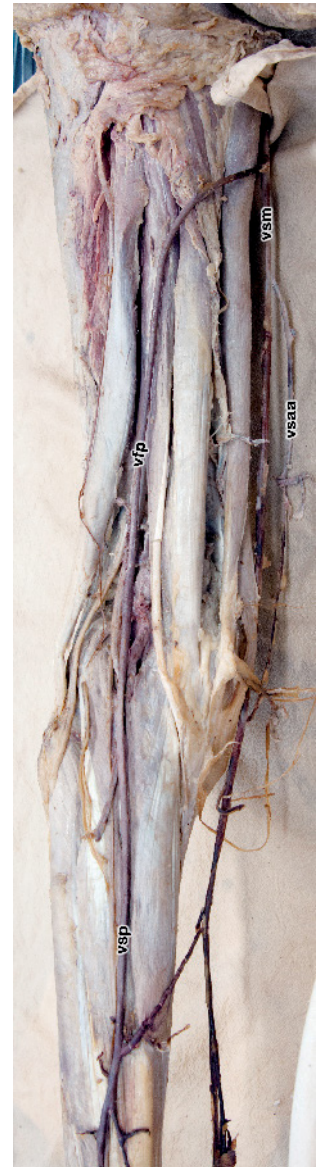
Abb. 5 V. femoropoplitea („ Giacomini-Vene “): Die V. saphena parva setzt sich als nahezu gleichkalibrige V. femoropoplitea auf den Oberschenkel fort; diese windet sich um den proximalen Oberschenkel und mündet in die V. saphena magna . Im Bereich der Kniekehle besteht eine kräftige Perforans („ Crosse “) zur V. poplitea . linkes Bein. Eigene Abbildung, Sezierskurspräparat. Quelle: Sektion für klinisch-funktionelle Anatomie, Medizinische Universität Innsbruck

Aus dieser generellen Situation ergeben sich je nach Ausprägung der einzelnen