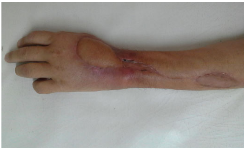
Fig. 3 Evolución luego de 1 mes postoperatorio.

El período postoperatorio transcurrió sin complicaciones (→Fig. 3). Se mantuvo la muñeca inmovilizada con una férula antebraquio palmar durante dos semanas, con movilización de los dedos desde el primer día. Acudió a la rehabilitación con una evolución satisfactoria, continuando con su tratamiento oncológico. A los 4 meses sufrió una recaída de su enfermedad y falleció.