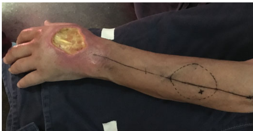
Fig. 1 Foto preoperatoria. Herida en dorso de mano con exposición de tendones del Extensor Digitorum Communis del segundo y tercer dedo. En antebrazo se marcó la perforante y se diseñó el colgajo.

vascularización del colgajo interóseo posterior en un paciente con una variable anatómica de esta arteria.