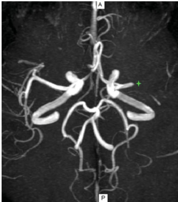
Fig. 2 Angioresonancia de vasos intracraneales. Reconstrucción en máxima intensidad de proyección (MIP), plano axial. Se observa ausencia de señal de flujo en la arteria cerebral media izquierda desde el sector distal del segmento M1, compatible con trombosis oclusiva (asterisco).

deshidratación. En esos casos, la hiperdensidad de la ACM se presenta de forma bilateral, lo que facilita el diagnóstico diferencial. La ateromatosis cálcica es otra entidad a tener en cuenta como diagnóstico diferencial, pudiendo ser uni o bilateral; en la mayoría de los casos los valores de atenuación son mayores a los evidenciados en el SACMH por el contenido de calcio.