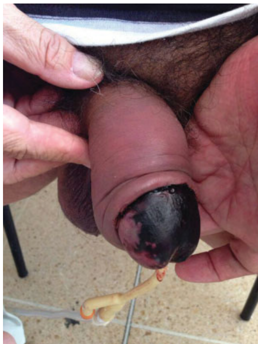
Fig. 1 Áreas necróticas en piel de glande. Sutura en surco balanoprepucial sana.

albugínea y se realizó la rafia de los cuerpos cavernosos con sutura continua con vicryl 3/0. Se calibró la uretra con bugía de Hegar # 7 y se realizó el cierre dorsal de la mucosa uretral con 6 puntos separados con vicryl 4/0 libres de tensión. Se pasó una sonda Foley de silicona 14Fr. Posteriormente, se avivaron los