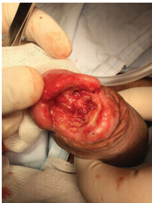
Fig. 2 Presentaba desprendimiento del glande en un 80% con áreas de necrosis en surco balano-prepucial del lado izquierdo, lesión de uretra en su parte distal y apertura del cuerpo cavernoso izquierdo. Se realizó lavado más desbridamiento de tejido necrosado y se fijó el glande al cuerpo cavernoso con punto de vicryl 3/0.

albugínea y se realizó la rafia de los cuerpos cavernosos con sutura continua con vicryl 3/0. Se calibró la uretra con bugía de Hegar # 7 y se realizó el cierre dorsal de la mucosa uretral con 6 puntos separados con vicryl 4/0 libres de tensión. Se pasó una sonda Foley de silicona 14Fr. Posteriormente, se avivaron los