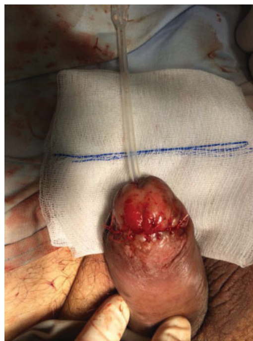
Fig. 4 Se realizó uretroplastia con cierre dorsal de la mucosa con vicryl 4-0 con 6 puntos separados libres de tensión previo al paso de sonda Foley de silicona 14 fr. Puntos hemostáticos de afrontamiento del glande por planos con vicryl 3-0.

Se describe el caso de un paciente que presentó necrosis de pene posterior a un priapismo inducido por la inyección