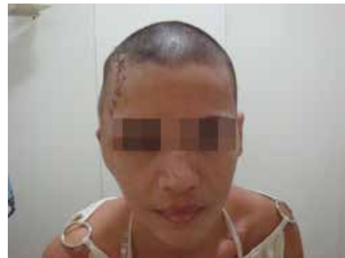
Figura 6 – Pós-operatório (10 dias).