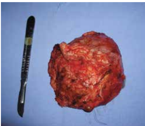
Figura 5 - Tumor após a ressecção cirúrgica.