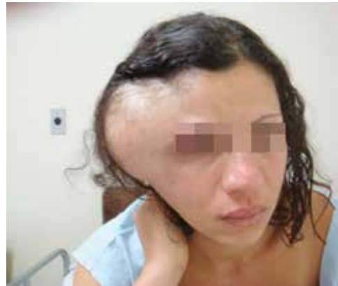
Figura 3 – Pré-operatório.