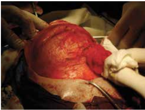
Figura 4 – Ressecção cirúrgica de hemangioma cavernoso extra-axial.

Relatamos o caso de uma mulher de 30 anos com uma massa palpável em região temporal direita, com diagnóstico de hemangioma cavernoso extra-axial confirmado pelo exame histopatológico. Apesar de observarmos na literatura que a maioria dos casos de hemangioma cavernoso é assintomática e com possibilidades de involução, o quadro clínico apresentou-se com alguns sintomas e uma evolução do tamanho da lesão incomum para esse tipo de lesão, justificando a abordagem terapêutica (Figuras 4 e 5).