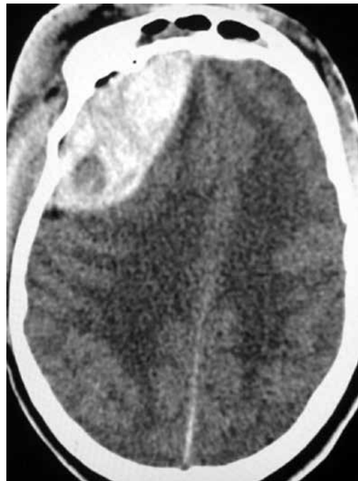
Figura 2 - TC de crânio sem contraste demonstrando na região frontal esquerda lesão extra-axial com densidade mista, presença do sinal do redemoinho e efeito de massa.