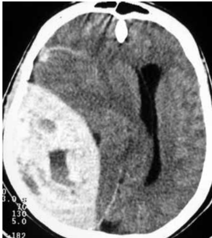
Figura 3 – TC de crânio sem contraste com volumoso hematoma epidural parietal direito, desvio das estruturas da linha média, densidade mista e presença do sinal do redemoinho.