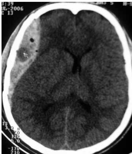
Figura 4 – TC de crânio sem contraste apresentando hematoma extradural parietal direito, efeito de massa e com dupla densidade, caracterizando o sinal do redemoinho.

A densidade do hematoma na TC depende do hematócrito, do conteúdo de proteína existente na hemoglobina, além de uma pequena participação das concentrações de protoporfirina e cálcio. O componente ferro participa com 7% a 8% da densidade do hematoma. 5 Assim, a aparência da hemorragia na TC varia dependendo do conteúdo sanguíneo. Em pacientes com perfil hematológico normal, ela é tipicamente hiperdensa na sua fase aguda, por causa do acúmulo de sangue coagulado. Em casos de pacientes portadores de coagulopatias, como deficiência de fatores da coagulação, e em caso em que o hematócrito seja abaixo de 23% ou em que a concentração de hemoglobina seja inferior a 8 g/dl, o hematoma se mostra isodenso em relação ao parênquima cerebral.