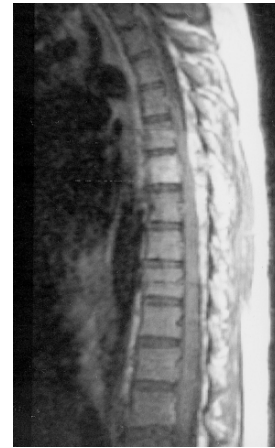
Figura 2 – Ressonância magnética pós-operatória, com contraste. Há realce do corpo vertebral de T6 após a injeção de contraste. Não há sinais de compressão medular. O leito operatório apresenta realce intenso.

Um mês e meio após a cirurgia, foi readmitida para colocação de haste de Hartshill, em virtude do grande comprometimento do corpo vertebral pelo processo. Nessa época, a força muscular dos membros inferiores havia melhorado até grau IV, a hipostesia havia desaparecido e notava-se controle adequado da diurese.