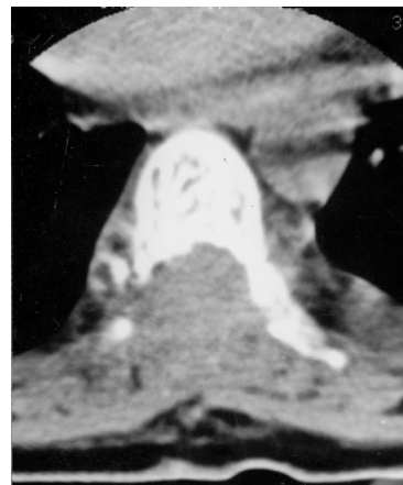
Figura 3 – Tomografia computadorizada pós-operatória, sem contraste, em janela para partes moles, mostrando a ampla descompressão. O corpo vertebral apresenta o aspecto típico em polka-dot.