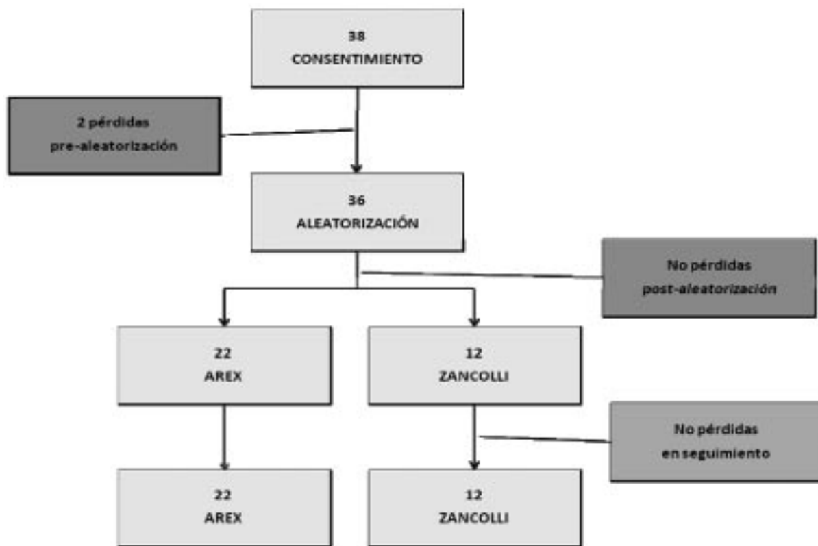
TABLA I – DIAGRAMA DE FLUJO SEGÚN LAS RECOMENDACIONES DEL CONSORT 22, 23