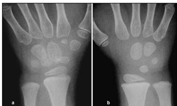
Figura 1: a) Aspecto radiológico de la muñeca izquierda. Desarrollo óseo de los huesos carpianos anormalmente evolucionado en comparación (b) con el lado derecho.

frió un episodio de dolor y tumefacción de su muñeca izquierda, aparecido espontáneamente dos meses antes de ser visitada en noviembre de 2002. No tuvo nunca fiebre. Durante el brote la niña había sido tratada con antiinflamatorios no esteroideos, que disminuyeron el dolor y la tumefacción; no obstante la movilidad no se recuperó, motivo por el cual nos fue derivada para estudio y tratamiento.