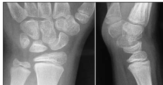
Figura 4: Aspecto radiológico a los 4 años y 10 meses de la intervención. Ligeros cambios en la forma del semilunar, y tendencia al VISI (ángulo radiolunar: 20° palmar). Desarrollo óseo casi simétrico en relación al lado contralateral.

temente, la niña había evolucionado mucho mejor de lo previsto, con un rango articular casi normal (déficit de tan sólo 15° de extensión y flexión pasivas), sin dolor y permitiéndole participar activamente en todas las actividades físicas propias de su edad. Radiológicamente destaca un semilunar levemente aplanado en su mitad palmar, bien vascularizado y con una correcta trabeculación interna, un hueso grande ligeramente subluxado anteriormente, y un escafoidees en una posición de relativa subluxación proximodorsal. La altura carpiana se halla levemente reducida respecto al lado contralateral, si bien todo ello en un contexto de remodelación articular muy notable ( Figura 4 ).