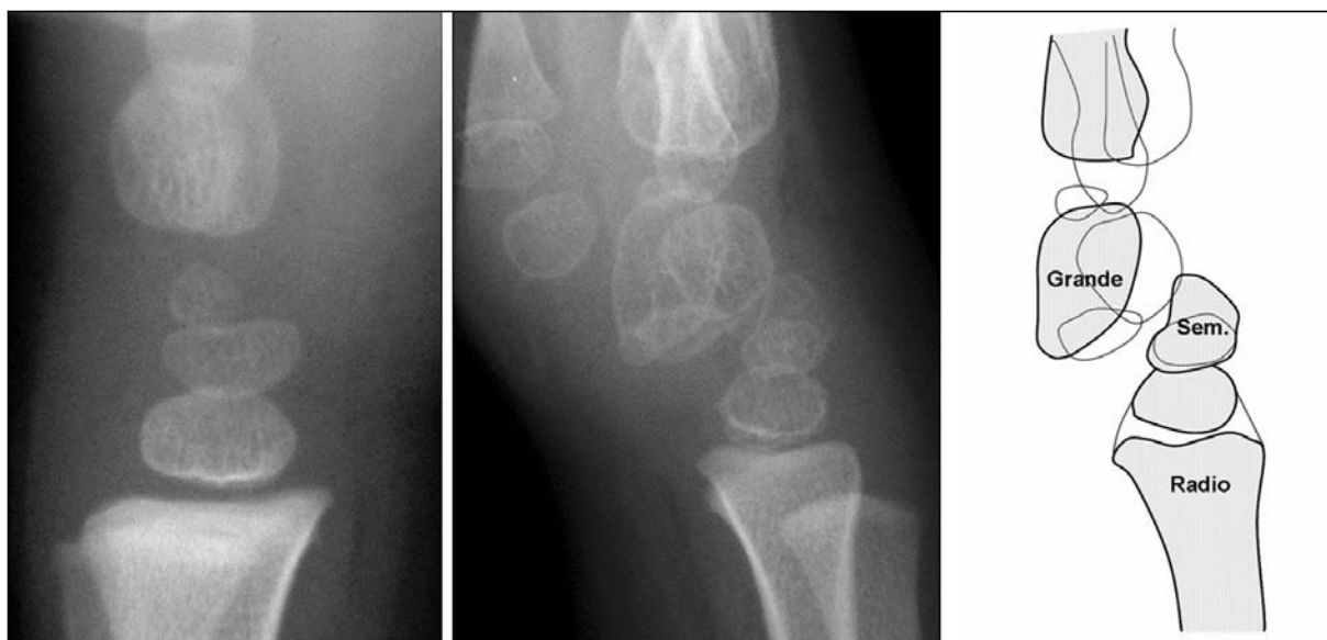
Figura 2: Subluxación palmar de la hilera proximal respecto al semilunar y escafoides, que están anormalmente flexionados (colapso carpiano en VISI). Ángulo radiolunar: 75° palmar.

A fin de reducir la desaxiación carpiana y obtener muestras artrosinoviales para su posterior análisis, se decidió intervenirla quirúrgicamente. Se abordó la cápsula radiocarpiana desinsertándola proximalmente del radio, momento en el cual pudo observarse la presencia de abundante sinovitis articular que se extirpó y se analizó histológicamente ( Figura 3a ). La incisión capsular se extendió distalmente a fin de exponer los espacios articulares radiocarpiano y mediocarpiano ( Figura 3b ). Con ello se pudo objetivar la presencia de una fila proximal del carpo anormalmente flexionada, si bien con integridad de los ligamentos interóseos escafolunar y lunopiramidal. Dicha subluxación se reducía muy fácilmente mediante tracción longitudinal de los dedos y compresión dorsopalmar del semilunar hacia su posición normal sobre el radio. Tras una sinovectomía articular minuciosa, se procedió a la reducción y estabilización de la articulación mediocarpiana mediante una aguja Kirschner