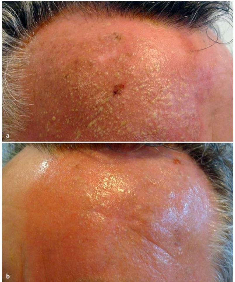
Abb. 2 Phototoxische Reaktionen auf (a) konventionelle PDT sowie (b) Tageslicht-PDT mit Metvix® Creme jeweils an Tag 3 nach Therapie.

Die klinische Effektivität der Tageslicht-PDT mit Metvix® Creme ist mit der einer konventionellen PDT mit Metvix® Creme vergleichbar. Vorteilhaft sind die deutlich geringeren Schmerzen bei der Tageslichtexposition im Vergleich zur Belichtung mit einer Rotlichtquelle sowie die milder ausgeprägten phototoxischen Reaktionen.