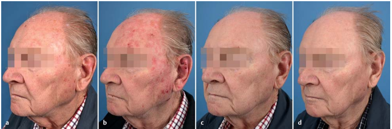
Abb. 3 Tageslicht-PDT mit Metvix® Creme bei Feldkanzerisierung. Die Abbildungen zeigen den Patienten vor (a), 4 Tage (b) und 1 Woche nach der 1. PDT (c) sowie nach Abheilung der phototoxischen Reaktionen nach der 2. Tageslicht-PDT (d).

lichkeit kann als sehr gut und nahezu schmerzfrei bezeichnet werden, sodass der Patient die Therapie jederzeit wieder durchführen würde.