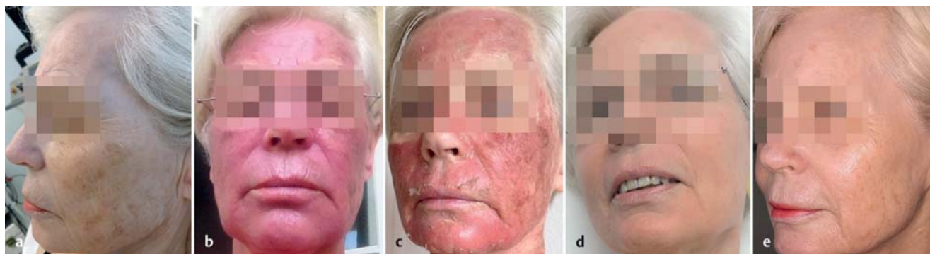
Abb. 4 69-jährige Patienten vor Tageslicht-PDT (a), 1 Tag (b), 6 Tage (c) und 13 Tage (d) sowie 1 Jahr (e) nach Durchführung der Tageslicht-PDT mit Metvix® Creme.