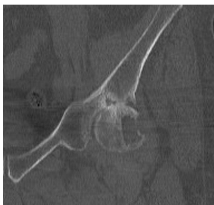
Abb. 4 Coronare CT der linken Hüfte mit großer Osteolyse am Übergang des Caput zum Collum femoris.