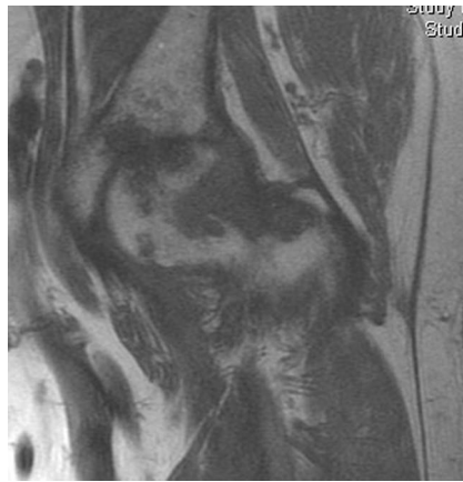
Abb. 5 MRT der linken Hüfte, COR FSE T1, ausgeprägte Knocheninfiltration im Bereich des Collum femoris

Es erfolgte ein umfangreiches Röntgen der schmerzenden Gelenke. Dabei zeigte sich ein ausgeprägter Erguss in beiden Ellenbogen und atypisch lokalisierte Usuren am distalen Interphalangealgelenk des Digitus III rechts, am Großzehengrundgelenk rechts als auch am Collum femoris sinister. Letztere erreichte einen Durchmesser von 16 mm. Darüber hinaus gab es degenerative Veränderungen im Sinne einer Polyarthrose und lumbal betonte Spondylarthrosen. Ein Versuch den ausgeprägten Gelenkerguss (46×34×14 mm) im linken Ellenbogen zu punktieren scheiterte aufgrund der hohen Viskosität des Ergusses. Die veranlasste Knochenszintigrafie zur Detektion von weiteren Herden ergab einen erhöhten Knochenstoffwechsel mit Weichteil-infiltration im Bereich der 2013 implantierten Hüft-TEP. Eine durchgeführte MRT der großen Erosion im Femurhals links ergab den Verdacht auf eine frühe Hüftkopfnekrose bei Kapsulitis und Synovialitis.