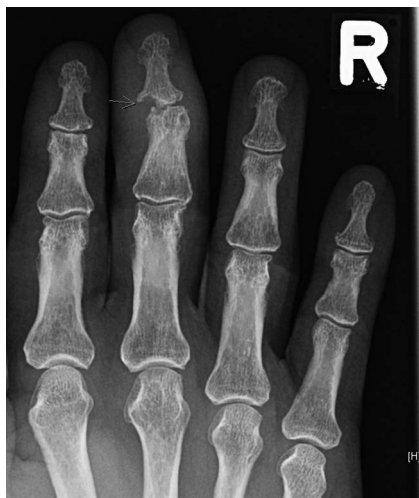
Abb. 3 Röntgenbild der rechten Hand, dorsoventral, mit Pfeil markierte Läsion am DIP 3.