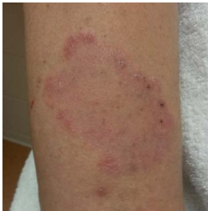
Abb. 1 Erythrosquamöse Effloreszenz rechter Unterarm.