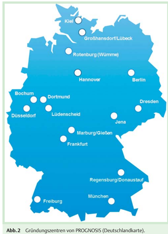
Abb.2 Gründungszentren von PROGNOSIS (Deutschlandkarte).