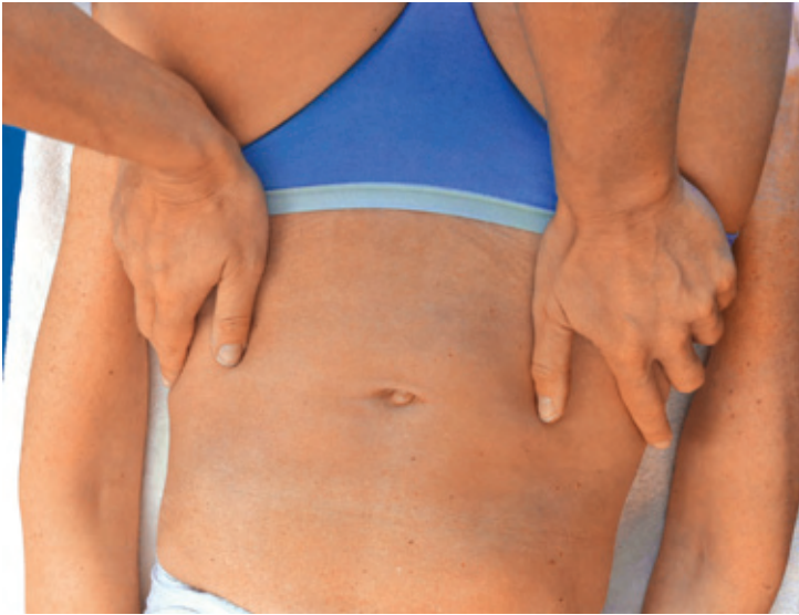
Abb. 4 Mobilisation des ISG in Rückenlage (Handhaltung).

Pathologischer Befund: Das Gewebe steht unter Spannung, es treten Schmerzen beim Verschieben auf, die Verschiebbarkeit ist vermindert.