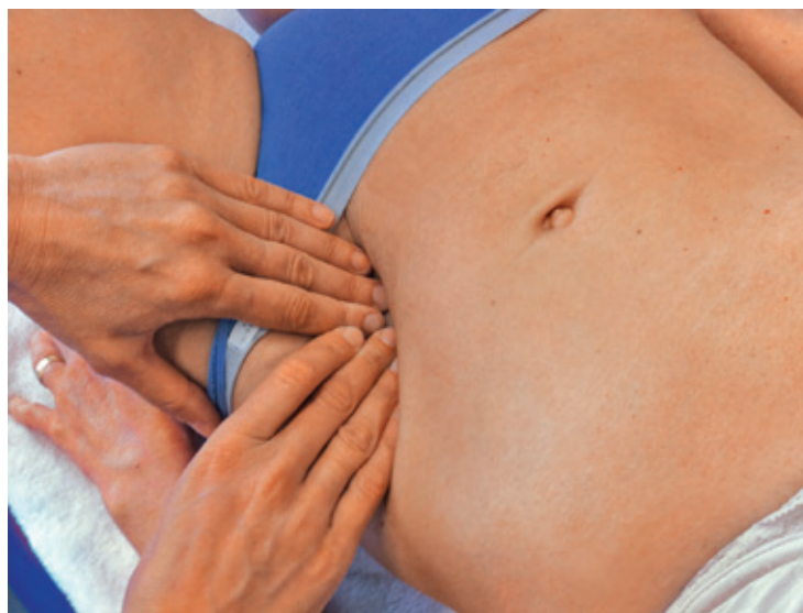
Abb. 3 Mobilisationstest Colon sigmoideum nach medial (Handhaltung).

Normalbefund: Das Gewebe ist frei von Spannung, beim Verschieben treten keine Schmerzen auf.