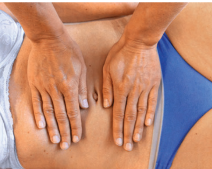
Abb. 2 Dichtetest des Abdomens oberhalb und unterhalb des Bauchnabels (Handhaltung).

Um festzustellen, ob das Colon sigmoideum sich innerhalb seiner fasziellen Aufhängung (Kasten) frei bewegen kann, führe ich einen Mobilisationstest des Dickdarmabschnitts nach medial und lateral durch.