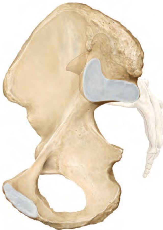
Foto: © Schünke M, Schulte E, Schumacher U. Prometheus. LernAtlas der Anatomie. Allgemeine Anatomie und Bewegungssystem. Illustrationen von M. Voll und K. Wesker. 3. Aufl. Stuttgart: Thieme; 2011

Bärbel K. gibt an, in den Wechseljahren zu sein, ihre letzte Monatsblutung liegt ca. 8 Monate zurück. Wegen gelegentlicher Hitzewallungen und Schlafstörungen denkt sie schon seit einiger Zeit über eine hormonelle Behandlung nach. Seit Beginn der Wechsel-