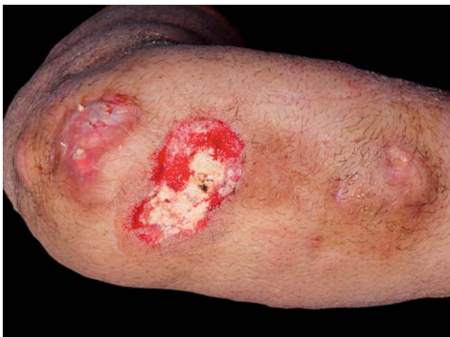
Abb. 4 Rechter Unterarm: Granulationsgewebe nach Vakuum-Therapie.