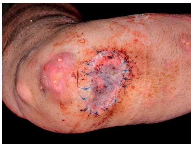
Abb. 5 Rechter Unterarm nach Spalthaut-Transplantation.

1-1-1 und Kalzium 500 1-0-0. Alendronat als antiresorptive Therapie wurde belassen. Quensyl und Prednisolon abgesetzt bzw. ausgeschlichen.