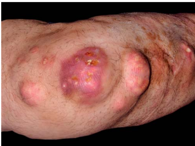
Abb. 1 Klinisch zeigten sich (hier rechter Ellenbogen/Unterarm) erythematöse Plaques und Knoten mit Ulzerationen.