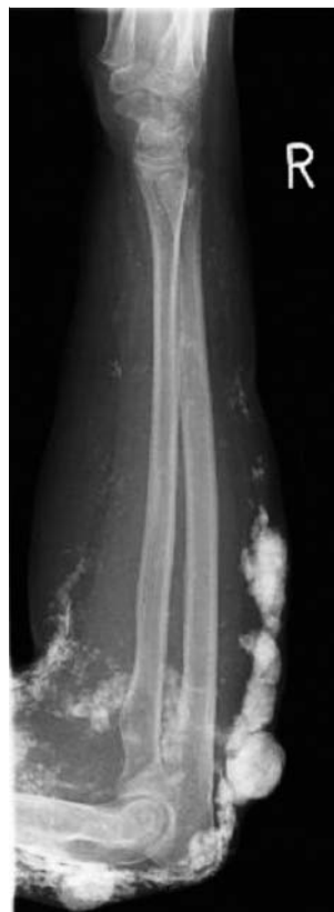
Abb. 3 Röntgendichte Kalzifikationen am rechten Arm.

In einem Exzidat zeigten sich im Korium großflächige Ablagerungen von Kalk mit beginnender Ossifikation (◉ Abb. 2 ).